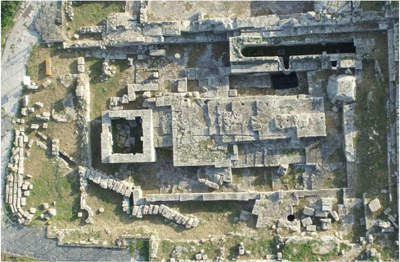
Fig. 3 - Il tempio delle semicolonne: sulla sinistra resti di una struttura romana; in alto la grande cisterna

Il nome è stato assegnato dallo scavatore Gennaro Pesce, a causa della particolare tecnica costruttiva della struttura. Difatti il basamento del tempio è stato ricavato dalla roccia viva "per via di levare", sino ad ottenere un podio terrazzato. Sempre con la medesima tecnica la due pareti lunghe e quella posteriore sono state ornate con semicolonne a rilievo (figg. 4-7).