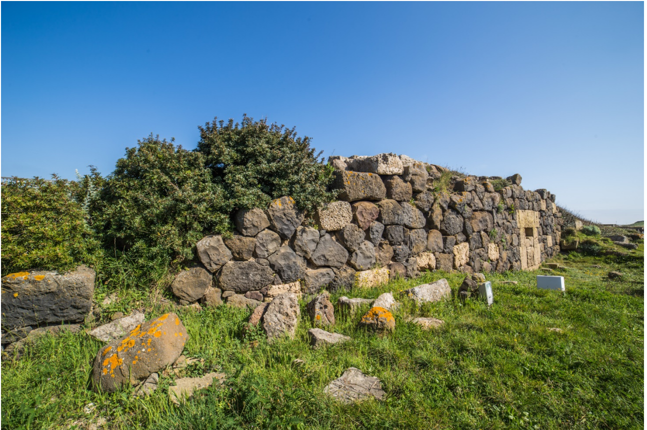
Fig. 4 - Il muro di cinta in basalto con blocchi regolari in arenaria

In questo muro si apriva una postierla, che fu occlusa poi in un secondo momento, anch'essa in arenaria (fig. 5).