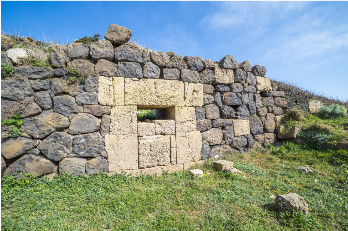
Fig. 5 - La postierla

La parte alta del muro è crollata, ma i resti del crollo ci mostrano come la sua sommità fosse dotata di merli arcuati (fig. 6).