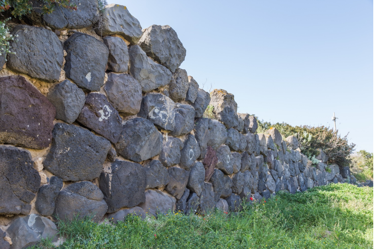
Fig. 7 - Il muro di controscarpa

Il muro di controscarpa è eretto con blocchi irregolari di basalto ed esternamente vi si poggia un potente aggere composto da strati di terra ed accumuli di sabbia (fig. 7).