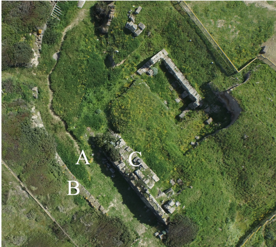
Fig. 3 - Le fortificazioni: A) il fossato; B) il muro di controscarpa; C) il muro di cinta (foto di Unicity S.p.A.. Rielaborazione di C. Tronchetti)

Il muro di cinta mostra tracce di diversi interventi, l'ultimo dei quali vede la struttura costruita in blocchi irregolari di basalto sovrapposti a secco, con l'inserimento di blocchi ben squadri in arenaria bianca, che compongono una sorta di motivo decorativo (fig. 4)