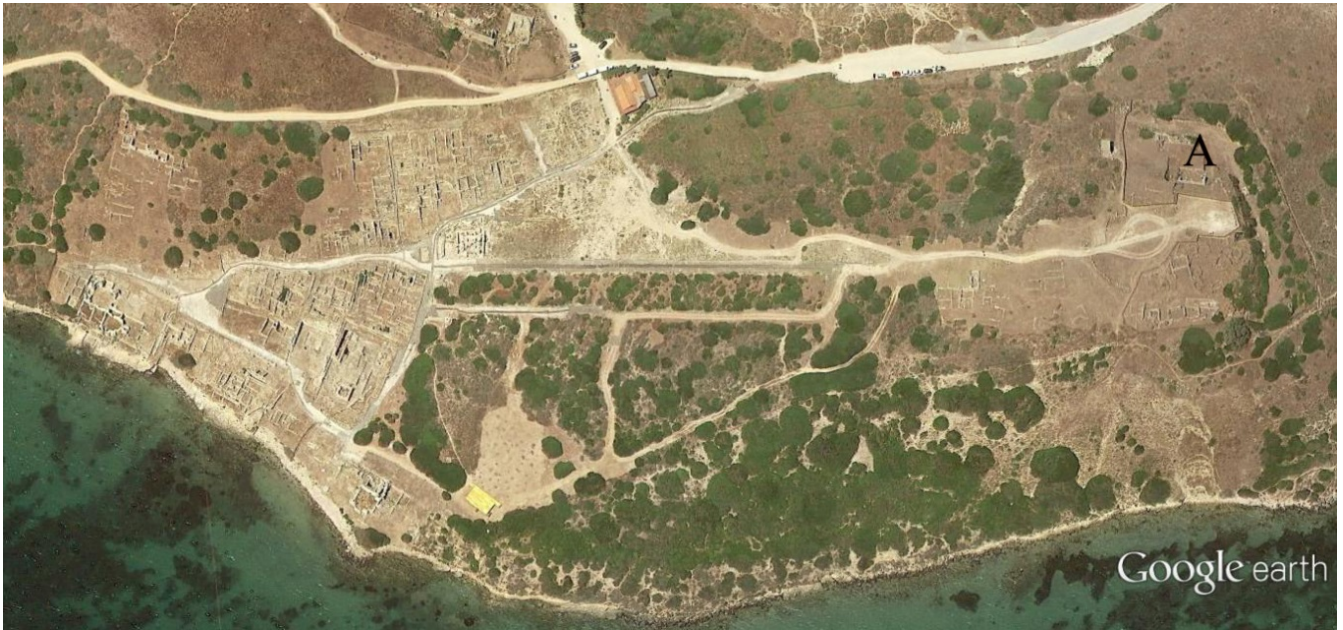
Fig. 1 - Tharros e la sommità del colle di Su Muru Mannu (A) (da Google Earth. Rielaborazione di C. Tronchetti)

La sommità del colle di Su Muru Mannu, che domina a settentrione la città di Tharros, costituiva un baluardo naturale verso l'entroterra (figg. 1-2), e per questo motivo fu fatto oggetto della costruzione di fortificazioni sino dall'età punica.