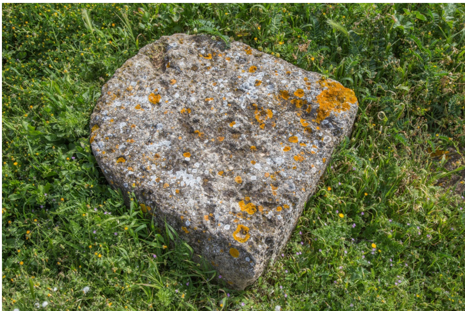
Fig. 6 - Un merlo delle mura di cinta

La parte alta del muro è crollata, ma i resti del crollo ci mostrano come la sua sommità fosse dotata di merli arcuati (fig. 6).