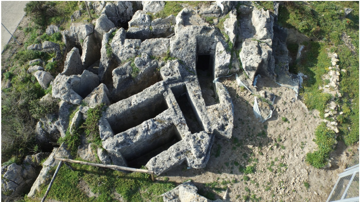
Fig. 4 - La necropoli meridionale