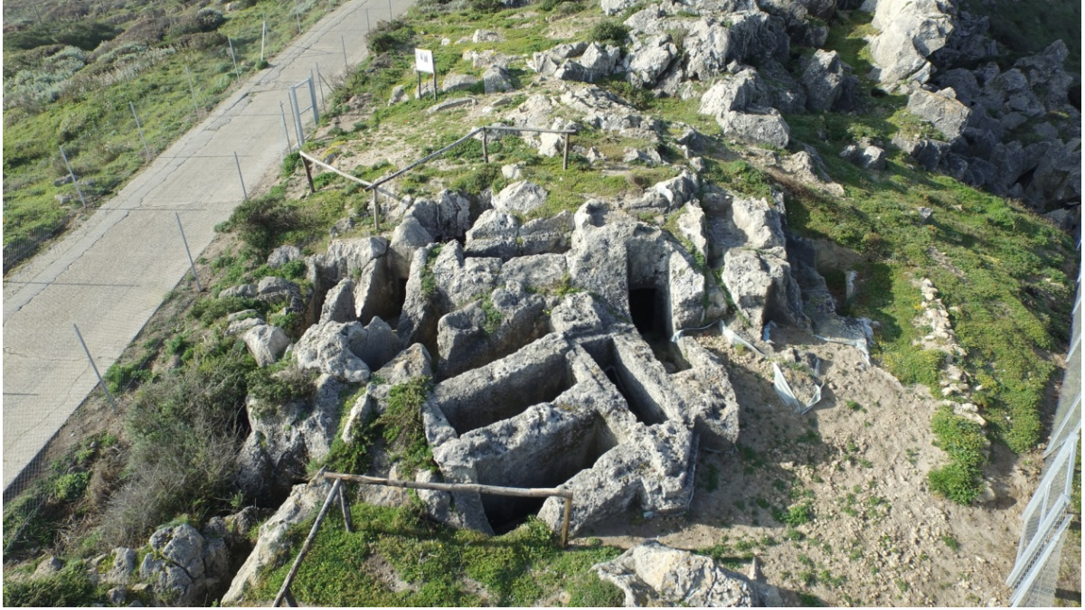
Fig. 3 - La necropoli meridionale