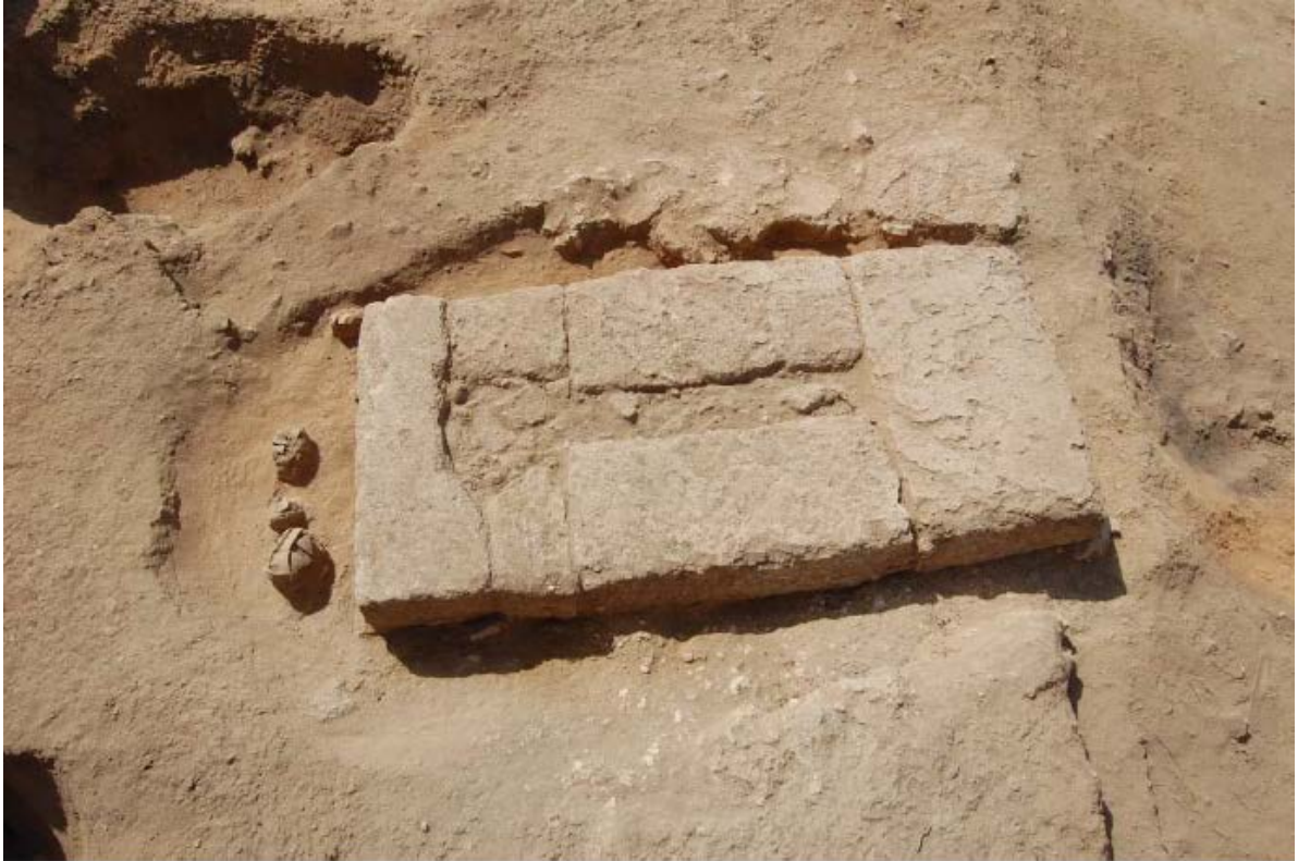
Fig. 4 - La tomba n. 56 della necropoli settentrionale di Tharros: copertura in blocchetti (da DEL VAIS, FARISELLI, 2012)

Le tombe a fossa potevano essere coperte con pietre oppure essere dotate di una copertura più accurata, con blocchetti che costituivano una sorta di platea sotto la quale stava l'incinerato con il suo corredo (figg. 4-5).