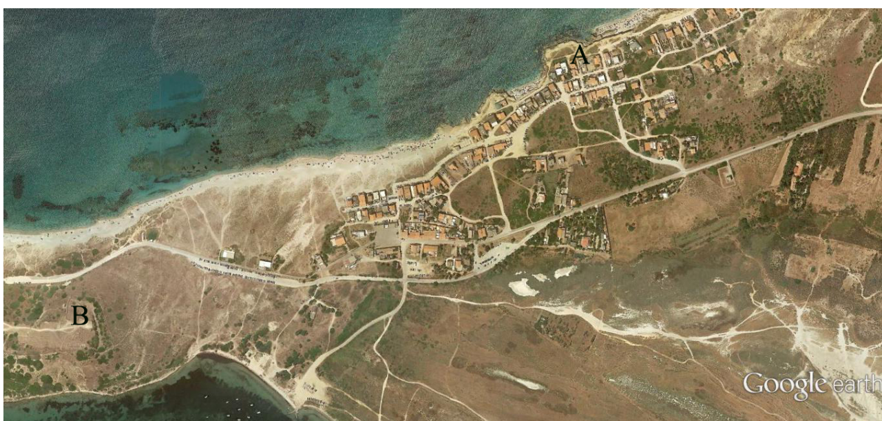
Fig. 1 - Localizzazione della necropoli settentrionale di Tharros. A) la necropoli; B) colle di Su Muru Mannu (da Google Earth. Rielaborazione di C. Tronchetti)

La città fenicio-punica di Tharros era dotata di due nuclei di necropoli, disposti a settentrione e meridione dell'abitato. La necropoli settentrionale, distante circa 1 chilometro dal colle di Su Muru Mannu, si trova compresa nell'area dell'attuale abitato di San Giovanni di Sinis, lungo la sponda del mare, ed ha subito danneggiamenti in epoca moderna per l'attività di una cava (fig. 1)