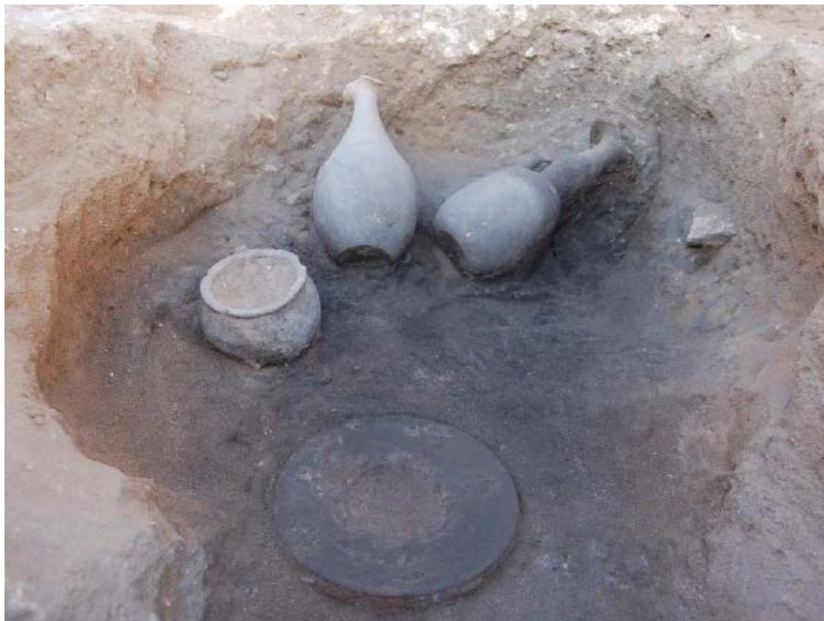
Fig. 3 - La tomba fenicia a cremazione n. 60 bis della necropoli settentrionale di Tharros (da DEL VAIS, FARISELLI, 2012)