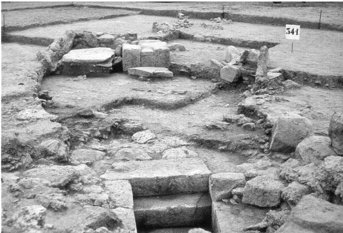
Fig. 3 - Il luogo di culto punico dinanzi al tempio a pozzo nuragico di Cuccuru S'Arriu (da DEL VAIS 2015)

Le localizzazioni preferite sono le campagne e le parti basse dei rilievi collinari, mentre nelle zone più elevate si ha una presenza sporadica, spesso legata al riutilizzo di antiche strutture nuragiche. Il fenomeno del riuso di tali strutture si verifica anche in altre situazioni, come nell'area del tempio a pozzo di Cuccuru S'Arriu, dinanzi al quale si imposta un piccolo luogo di culto (figg. 3-4).