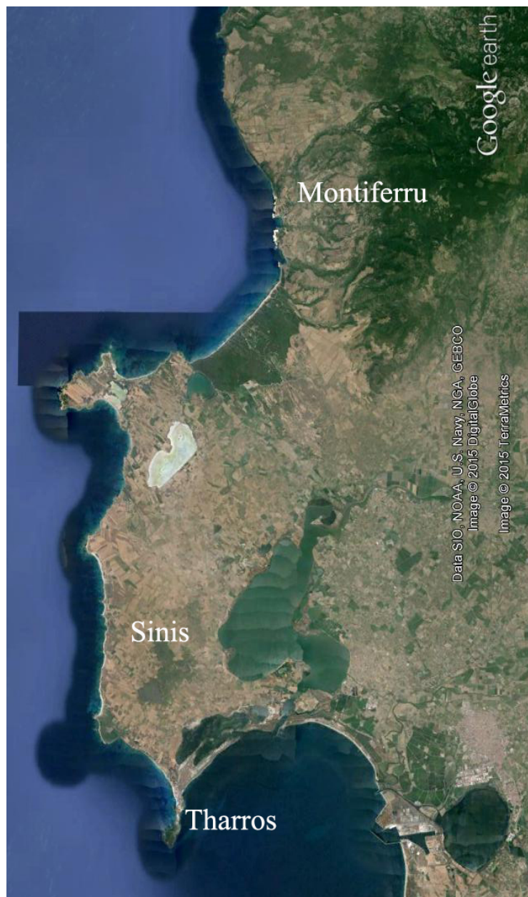
Fig. 1 - Il territorio del Sinis e del Montiferru in rapporto a Tharros (da Google Earth. Rielaborazione di C. Tronchetti)

Il centro urbano di Tharros nasce nel Sinis, un territorio felice per l'insediamento umano, cui concorrono il facile approdo nel Golfo di Oristano, la pescosità delle acque, la caccia, la fertilità del suolo e la ricchezza in metallo del Montiferru, pochi chilometri più a settentrione (fig. 1).