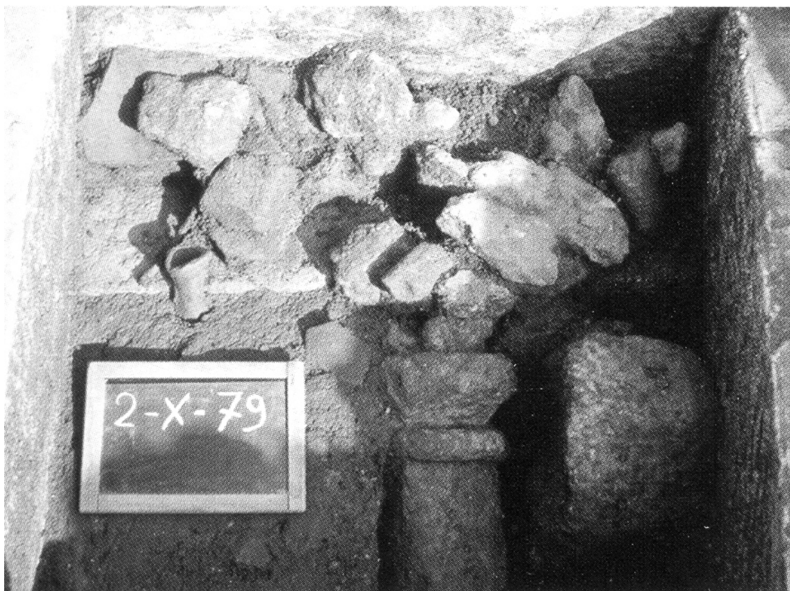
Fig. 4 - Parte del deposito votivo del sacello punico di Cuccuru S'Arriu (da DEL VAIS 2015)

In complesso si può affermare che la presenza punica nel territorio segue determinate scelte insediative tese al miglior sfruttamento della campagna e delle sue risorse. La razionalità della disposizione degli insediamenti condusse al loro mantenimento in uso per tutta l'epoca repubblicana romana, sino al momento della radicale trasformazione avvenuta in Età Imperiale.