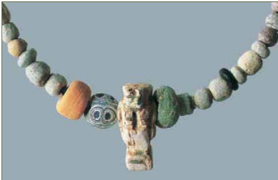
Fig. 3, 4 - Il complesso delle tombe 42-46-47 (BARTOLONI 2000, tav. XXII); collana in pasta vitrea con amuleto egittizzante (BARTOLONI 2004, fig. 46).