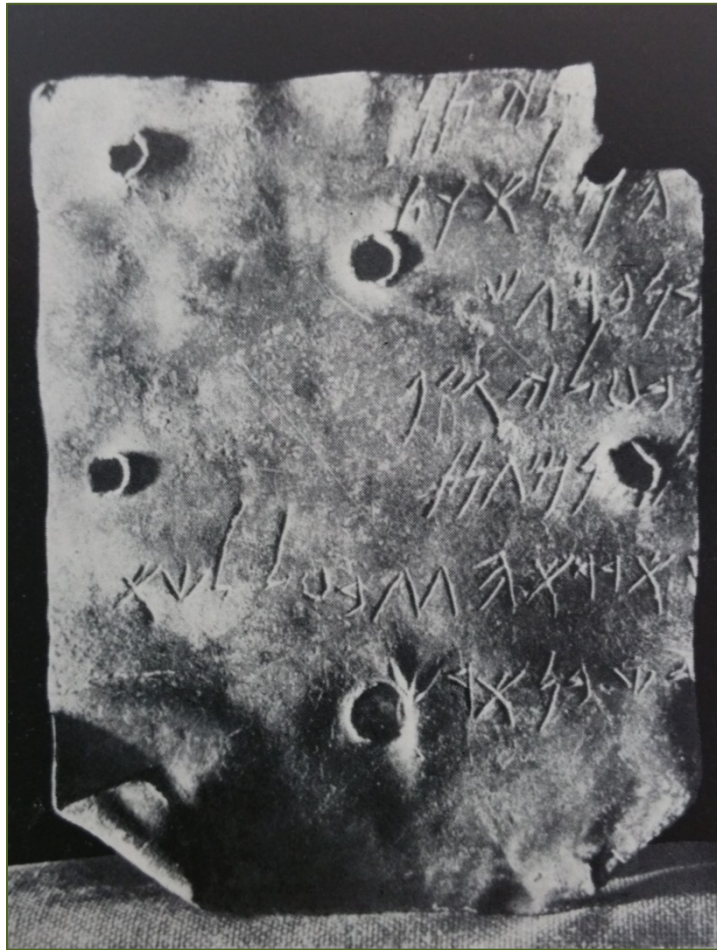
Fig. 2 - Tempio di Antas (Fluminimaggiore). Iscrizione su lamina bronzea (FANTAR 1969, Pl. XXV,2)

Può essere interessante ricordare un manufatto affine, l'iscrizione sempre in lamina bronzo rivenuta nel corso degli scavi presso il tempio di Sid ad Antas. Databile al V secolo a.C., parla di uno specialista delle 'coperture del tetto' (presumibilmente templare).