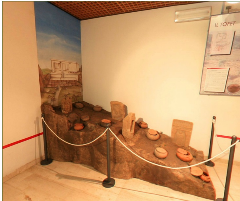
Fig. 5 - Ricostruzione di parte dell'area del tofet di Monte Sirai.

Il museo è collegato ai monumenti del territorio: assieme meritano ammirazione per il servizio proposto e il massimo degli sforzi, e delle iniziative pubbliche, in direzione di un sviluppo basato su cultura e paesaggio che porti conoscenza e nuova ricchezza.