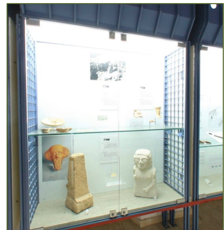
Figg. 3, 4 - Ricostruzione del nuraghe Sirai; vetrina con vari materiali fenici e la statua di Astarte.