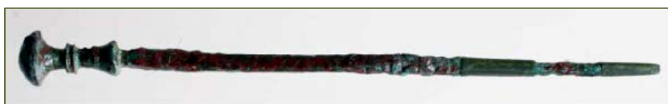
Fig. 5 - Stiletto nuragico (PERRA 2012, fig. 6).

Di rilievo il ritrovamento, nell'area vicina al nuraghe, di uno stiletto in bronzo a capocchia modanata, tipico della panoplia nuragica e attestato in altri luoghi di integrazione, come ad esempio nel centro sacro di Antas, presso Fluminimaggiore.