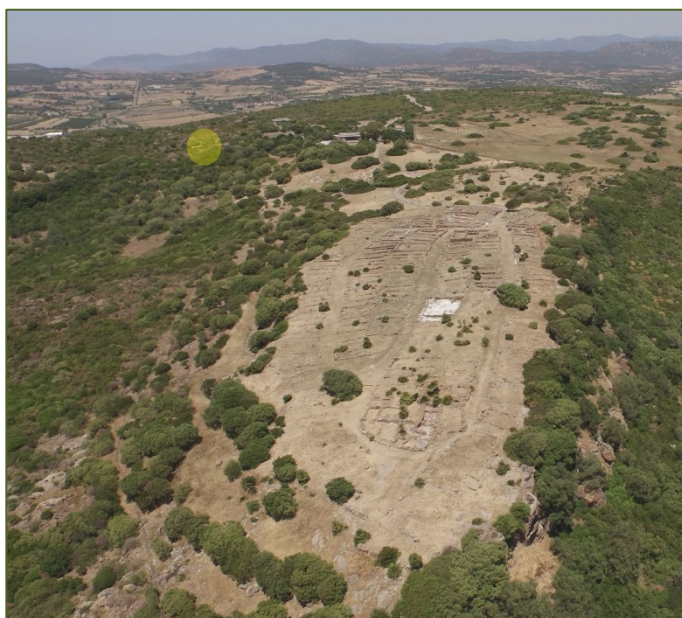
Fig. 1 - L'insediamento di Monte Sirai. Evidenziata la posizione del tofet.

La presenza del tofet , il santuario fenicio riservato alle morti infantili (per rito sacrificale periodico secondo alcuni studiosi, secondo altri per morti premature o aborti: ma la cerimonia prevedeva in ogni caso una sacrificio di purificazione attraverso il fuoco) 1 , è la dimostrazione della cultura urbana e di un accresciuto popolamento del luogo, che interessa topograficamente Monte Sirai come da tradizione nelle città fenicie, ai margini dell'abitato (fig.1) 2 .