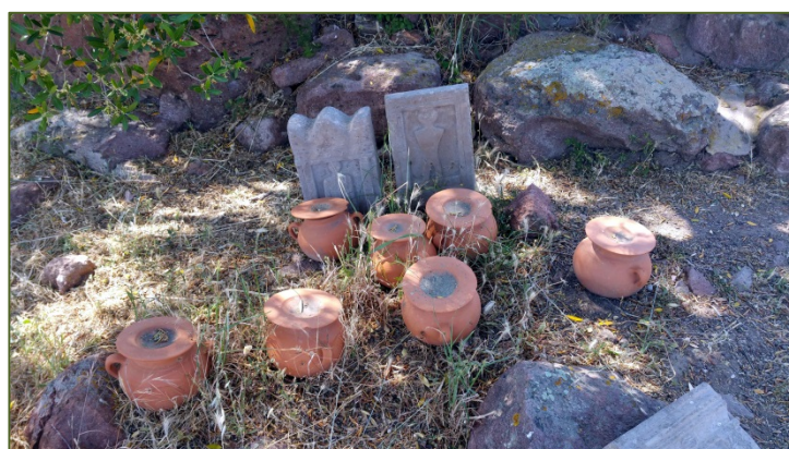
Figg. 3, 4 - Planimetria del tofet con distribuzione e tipi delle urne (GUIRGUIS 2013, fig. 7); riproduzioni di urne e stele del tofet di Monte Sirai