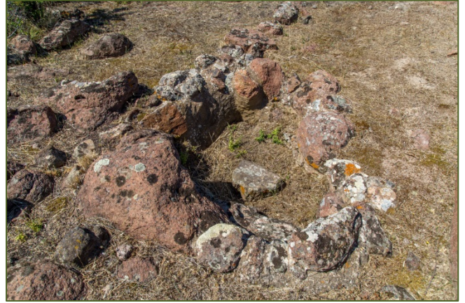
Figg. 6, 7 - Ambienti e focolari del santuario del tofet.