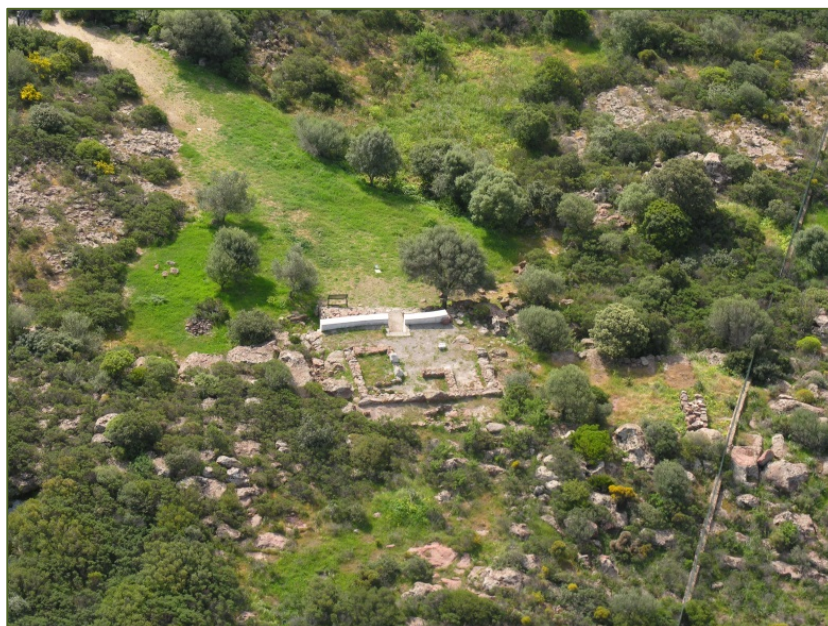
Fig. 2 - L'area del tofet (GUIRGUIS 2013, fig. 7).

Il santuario è costituito da un'area funeraria nella quale le urne, di foggia molto affine e contenenti le ceneri delle vittime infantili, venivano coperte da piattelli e interrate (ne sono state rinvenute circa quattrocento: fig. 3), recando a vista, ma non per tutte le deposizioni, un segnacolo costituito da stele in pietra con vari tipi e raffigurazioni: a volte in stile egittizzante, altre in stile grecizzante o più lineare, talora entro sacelli o tabernacoli riproducenti architetture templari (fig. 4).