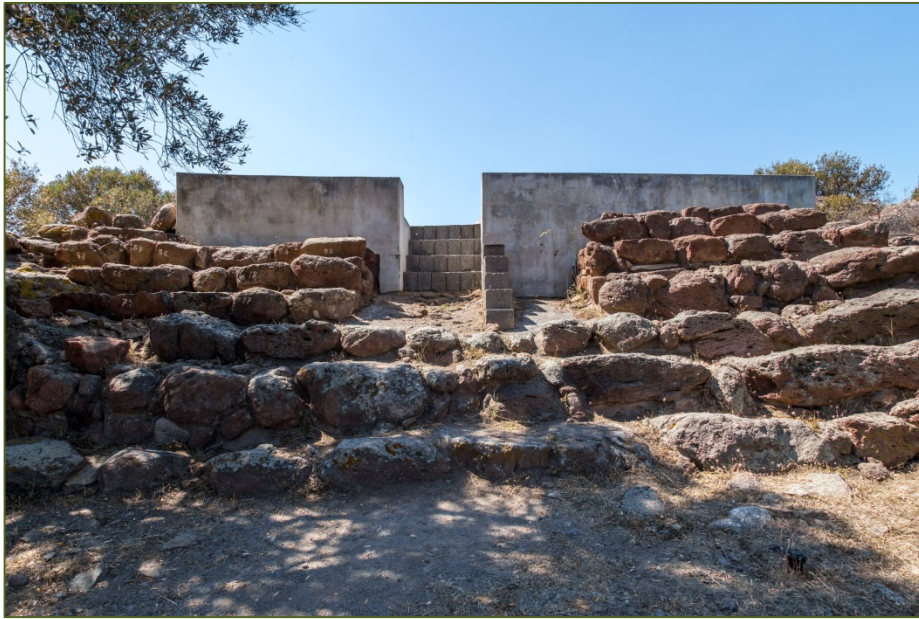
Fig. 5 - La scalinata del tofet.

Dall'area funeraria alcuni gradini (non i sette della scenografica gradinata monumentale, ricostruita con molte forzature negli scavi degli anni Sessanta (fig. 5) 4 : dovrà essere sostituita da una nuova sistemazione): conducevano a una rampa e infine