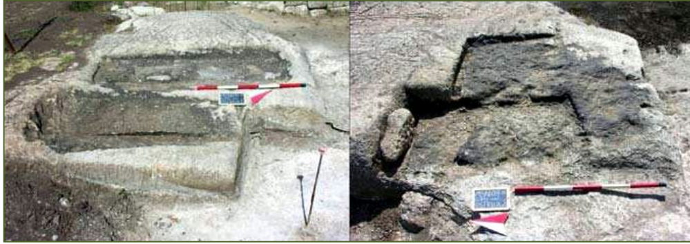
Fig. 3 - Settori adibiti a ustrinum collettivo (GUIRGUIS 2012, fig. 6).

Dal punto di vista storico e culturale è perciò possibile ipotizzare la compresenza, in parallelo ai nuclei cartaginesi legati alle tombe a camera scavate nella roccia, di altri ceti e popolazioni: alcune di esse, almeno in parte autoctone, sono legate ancora alle precedenti tradizioni fenicie. Vanno infine ricordate frequentazioni del sito in tempi molto antichi, poiché sono stati rinvenuti non lontano alla necropoli punica livelli relativi alla cultura eneolitica sarda di Monte Claro (che mostrerebbe anche in questo caso una particolare attitudine per lo stanziamento in luoghi di altura) 3 .