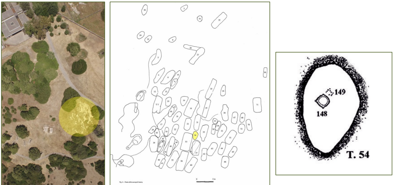
Figg. 1, 3 - Immagine dall'alto della necropoli fenicia; ubicazione della tomba fossa e sua planimetria (BARTOLONI 2000, figg. 7; 17).

La tomba n. 54 è una piccola tomba a fossa all'interno della necropoli fenicia (fig. 1), nella sua zona meridionale 1 (figg. 2-3). Appartiene ad un bambino ivi sepolto con il rituale dell'incinerazione, fra la fine del VII ed i primi tempi del VI secolo a.C. Lo strato di cenere con materiali organici indica che il rogo avvenne entro la fossa 2 .