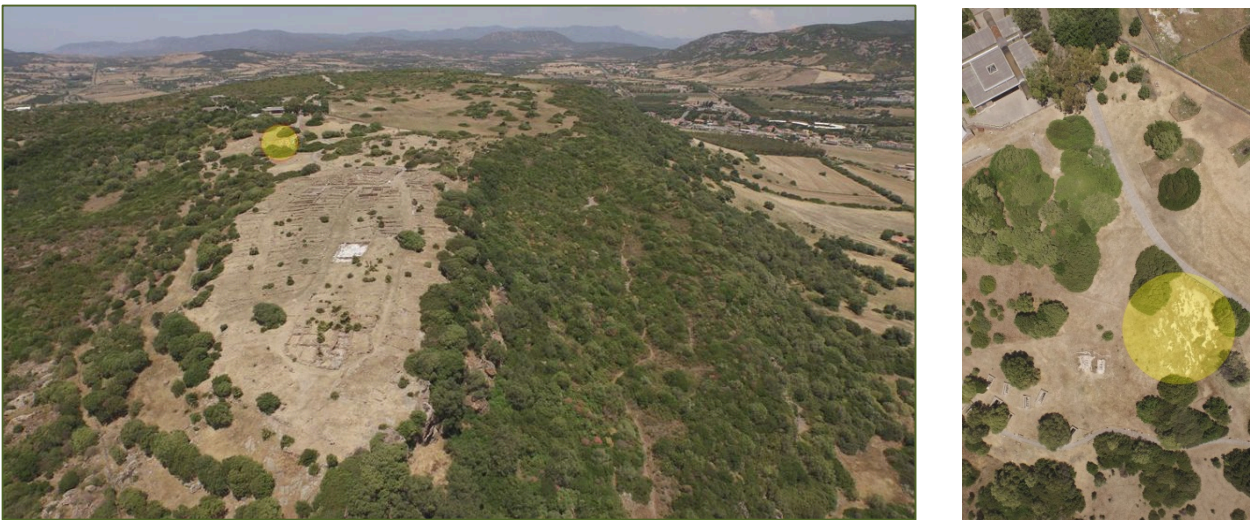
Figg. 1-2 - L'area della necropoli fenicia (evidenziata) - (foto Unicity S.p.A.)

La necropoli fenicia costituisce, con datazione fra la parte finale del VII secolo a.C. e il secolo successivo, il gruppo di sepolture più antiche documentato sinora a Monte Sirai 1 .