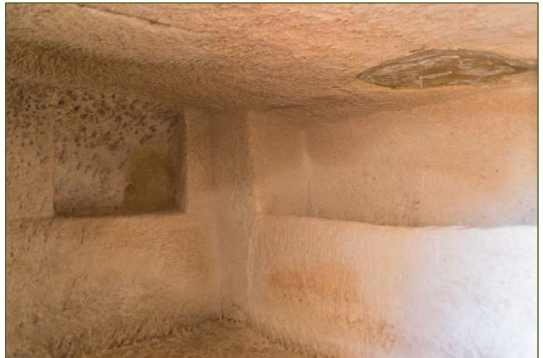
Figg. 2, 3 - Planimetria della tomba 1 (BARTOLONI 2000 fig. 22); interno della camera.

Purtroppo l'intervento degli scavatori clandestini, che ebbero ad agire diffusamente anche su Monte Sirai, fece cadere la testa scolpita sul soffitto 4 , fortunatamente recuperata ed ora conservata nel Museo Archeologico Nazionale di Cagliari.