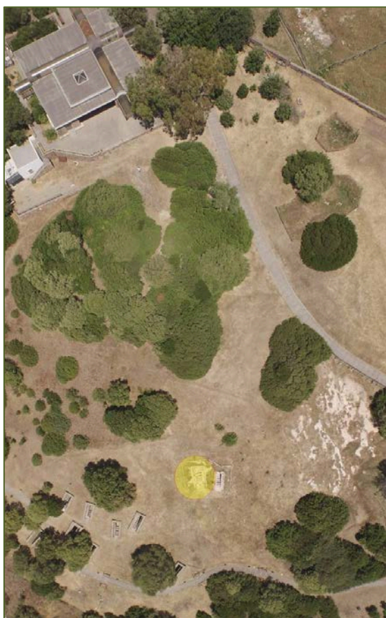
Fig. 1 - Immagine dall'alto della necropoli ipogeica.

Più a est la necropoli a incinerazione (fig. 1). Lo schema del monumento, che condivide quello generale della necropoli 1 ed è scavato nel banco roccioso tufaceo, è costituito da un corridoio d'accesso, detto dromos , che porta alla camera funeraria (fig. 2). La tomba appartiene al periodo della conquista cartaginese, del quale è spazio sepolcrale la necropoli ipogeica, fra il V ed il III secolo a.C. 2