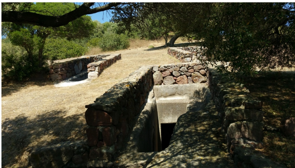
Fig. 3 - Area della necropoli ipogeica. Particolare

Si distinguono per l'uso dei pilastri e per decorazioni figurate e simboliche (come le maschere in rilievo nei soffitti, o un segno della dea Tanit, rovesciato, su un pilastro nella tomba n. 5 (fig. 5). Notevoli anche le rese dei sarcofagi ricavati nella roccia (fig. 4), nicchie e, purtroppo evanide, di tracce di pittura rossa.