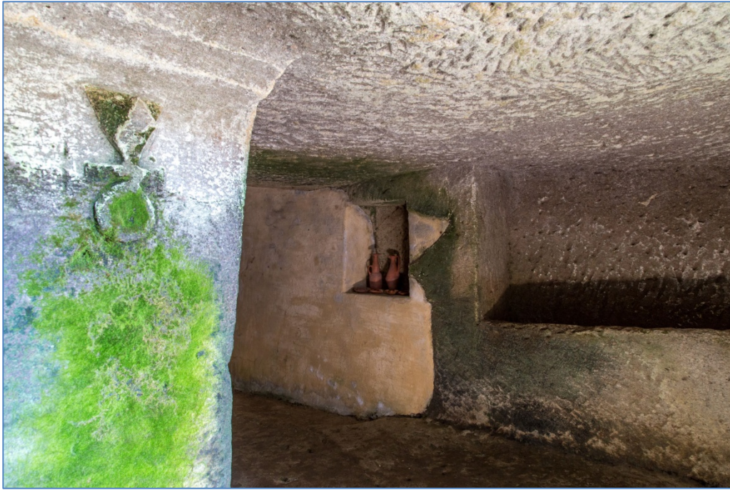
Fig. 5 - Pilastro con segno capovolto della dea Tinnit dalla tomba '5'