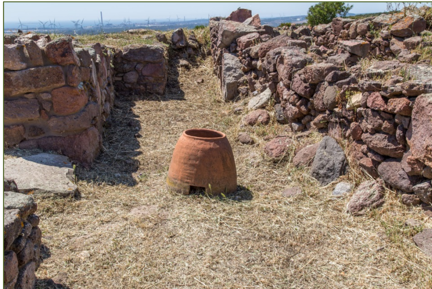
Fig. 3 - Ricostruzione di tannur

Si tratta di dolii tuttora in uso nel nord-Africa più tradizionale. Nel mondo fenicio e punico si presentano talora con profonde impressioni digitali sulla parte esterna dell'orlo.