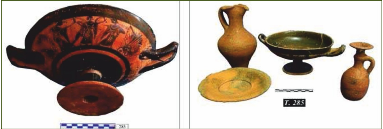
Fig. 3 - Il corredo della tomba 266, con la kylix attica a figure nere (da GUIRGUIS 2012, fig. 8).