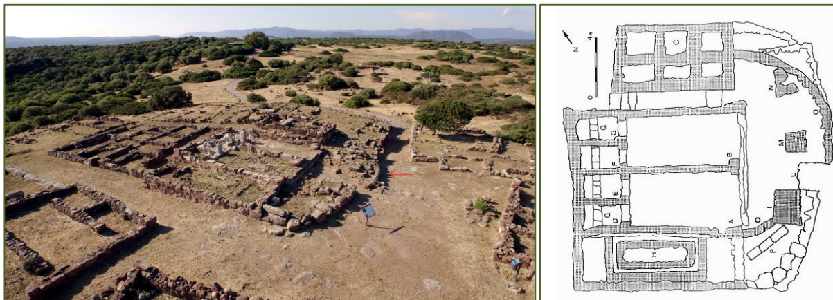
Figg. 2, 3 - La traccia circolare del nuraghe sotto il 'tempio di Astarte' (pianta da BARTOLONI 2004, fig. 13)