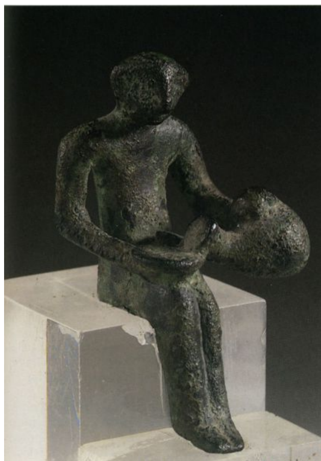
Figg. 4, 5 - Tratto di muratura residua della torre nuragica; bronzetto con brocca di tipo askoide (foto UNICITY S.p.A.; MOSCATI 1988b, p. 427)