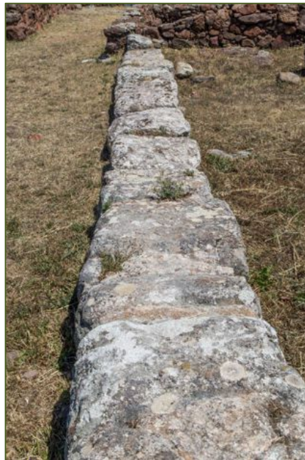
Fig. 7 - Muro portante in opera quadrata.

Significativo appare l'impiego di grandi blocchi in opera quadrata come muri portanti (fig. 7).