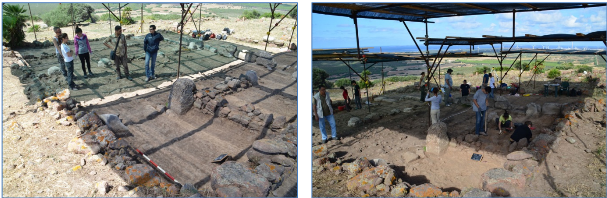
Figg. 6, 7 - Monte Sirai, giugno-luglio 2015: scavi nella 'Casa di tufo'.