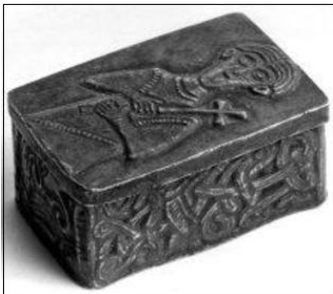
Fig. 2 - Reliquaire en argent de Sant' Apollinare, VI e -VII e siècle ( https://www.buonconsiglio.it/index.php/Castello-del-Buonconsiglio/collezioni/Arte-medievale ).