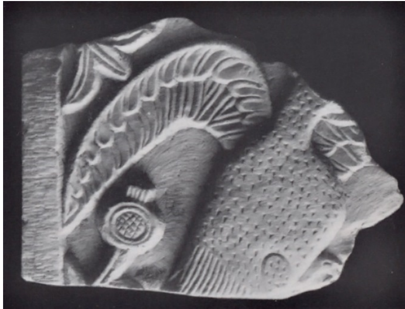
Fig. 2 - Fragment du petit arc d'un ciborium.