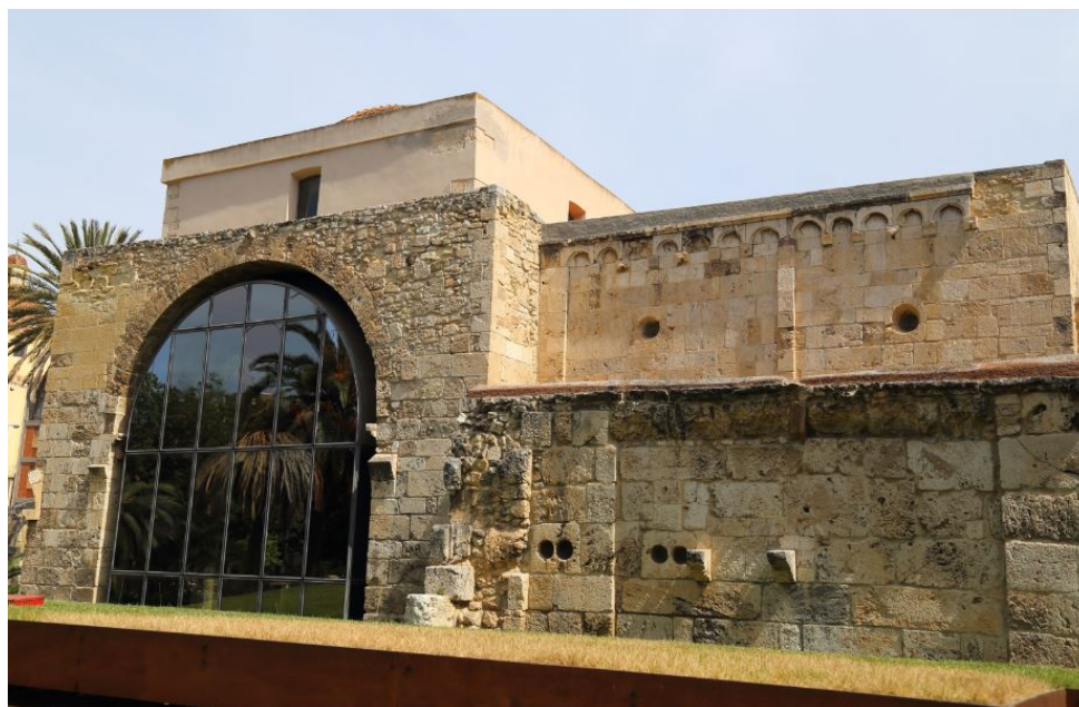
Fig. 1 - La basilique S. Saturnino.

Dans le secteur de la basilique (fig. 1) dans les années 50, on découvrit sept fragments de petits arcs appartenant à un ciborium (fig. 2), la structure architecturale qui domine et couvre l'autel, analogue à baldaquin (fig. 3-4). Ils sont réalisés avec des plaques de marbre blanc, mutilées, décorées d'encadrements en listel, de paons, d'une croix, de feuilles et d'autres éléments phytomorphes. Ils présentent des points communs avec différents objets sculptés architecturaux faisant partie d'églises, découverts dans toute la Sardaigne méridionale et appartenant à la production hellénistique moyenne, également bien documentée en Italie du Sud, surtout en Campanie. On les date de la deuxième moitié du X e siècle et ils sont un signe de vitalité et d'importance du mobilier de l'église, peut-être par rapport à un usage chrétien rétabli, selon les hypothèses d'une présence musulmane sur le site, attestée par différents objets, comme un graffiti en caractères coufiques et une inscription (cf. pièces n° 6). Après la découverte et les restaurations de l'église, ils furent scellés dans le mur de tamponnement de l'arcade nord du corps à coupole - qui n'existe plus aujourd'hui et qui a été remplacé par des baies vitrées - aujourd'hui erratiques.