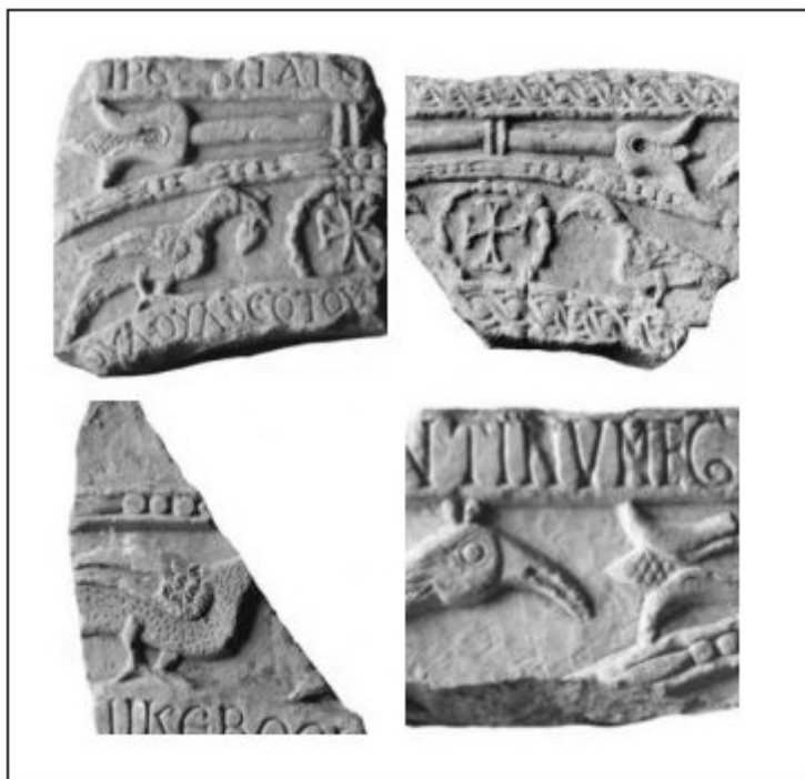
Fig. 4 - Fragments en marbre de l'époque byzantine (deuxième moitié du X e siècle), Nuraminis, église S. Pietro (CORRIAS, COSENTINO 2002, fig. 37, p. 271).