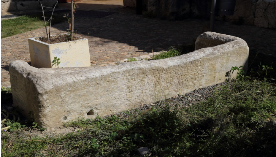
Fig. 1 - Sarcophage de Bonifatius.