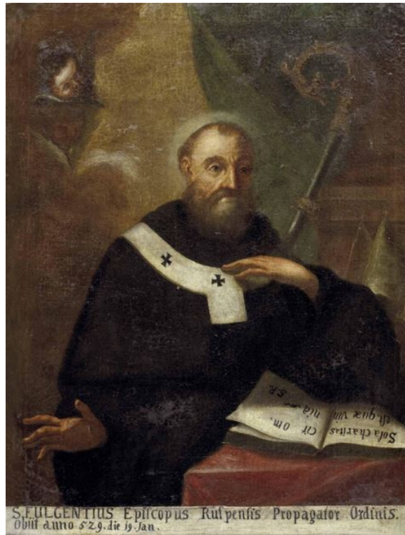
Fig. 3 - Fulgence de Ruspe ( https://unaltrasestu.files.wordpress.com/2014/07/fulgentius_von_ruspe_17jh1.jpg ).