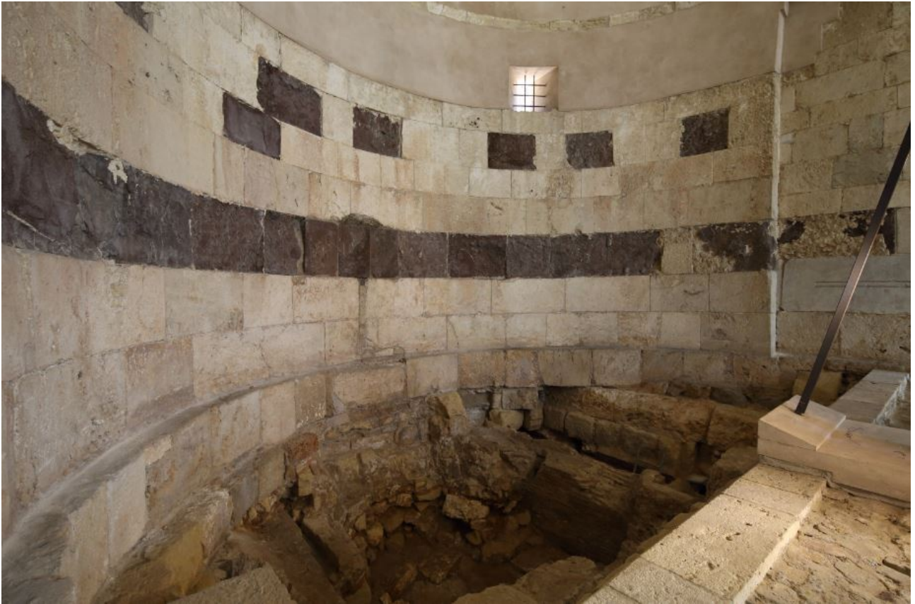
Fig. 2 - Détail de l'abside du bras oriental.