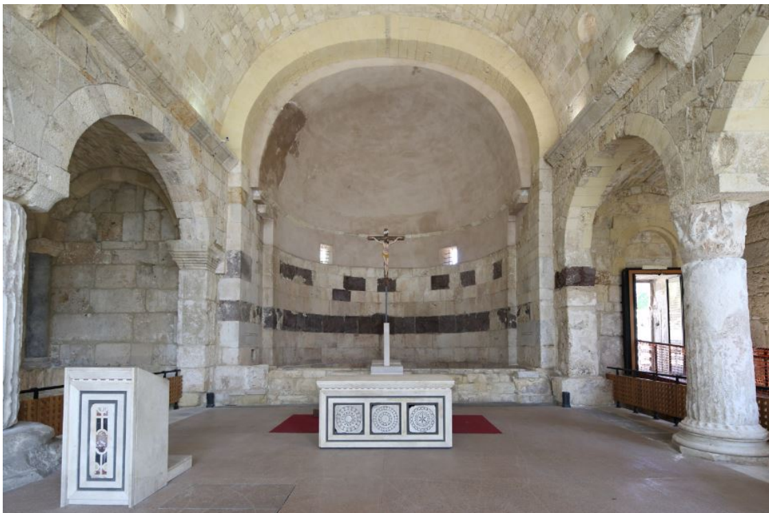
Fig. 1 - Bras oriental à trois nefs avec des ébauches du bichromie dans l'abside.

On reconnaît également des éléments architecturaux de recyclage, très fréquents dans toute la structure du bâtiment : sur les côtés de l'abside, on avait intégré de grands blocs en marbre blanc, avec des caissons sur les côtés courts concaves, que l'on identifie comme les architraves d'origine.