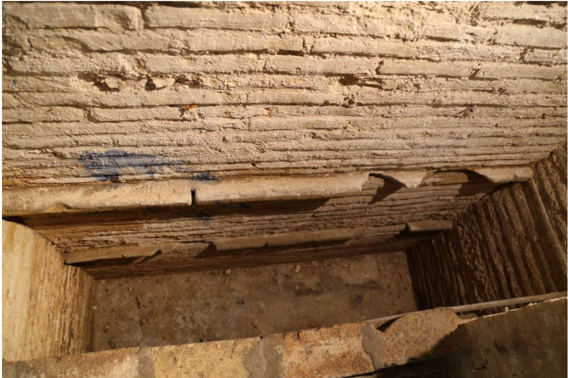
Fig. 4 - Deuxième église souterraine : détail d'un arcosolium avec les logements pour la superposition des tombes.