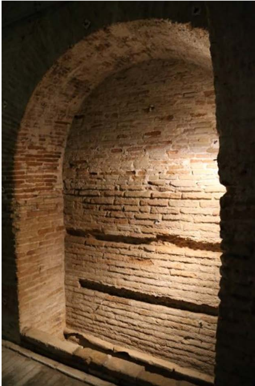
Fig. 3 - Deuxième église souterraine : arcosolium.