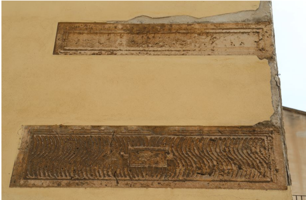
Fig. 1 - Sarcophages en pierre emmurés à l'extérieur de l'église S. Lucifero