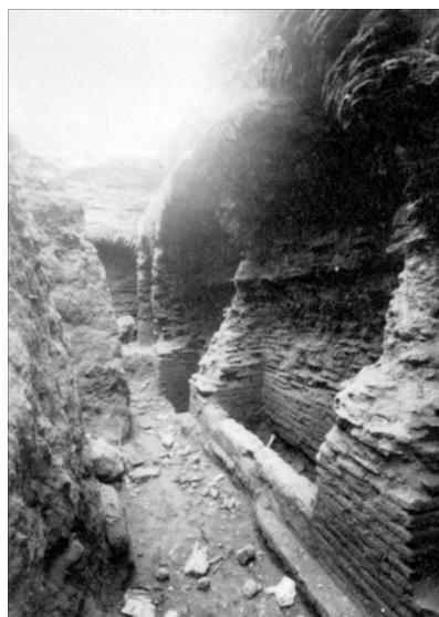
Fig. 4 - Salle funéraire dans l'église S. Lucifero en 1947-48 (Mureddu et alii 1988, p. 159).