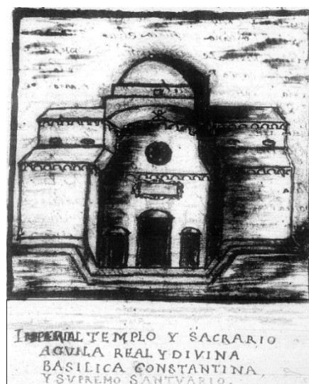
Fig. 1 - Dessin du XVII e siècle de la basilique S. Saturnino (Carmona 1631, f. 62v).

Mentionné par Fara au XVI e siècle comme un bâtiment à l'extérieur de la cité, le site littéralement bouleversé par les recherches des « corps saints » au XVII e siècle, dans un contexte historique et social caractérisé par la Contre-réforme et par la diatribe avec le siège de l'évêché de Sassari pour le titre de primat : l'archevêque de Cagliari Desquivel promut une intervention de fouilles massives dans le but de mettre au jour le plus grand nombre possible de reliques des martyrs, ou réputées comme telles, pour augmenter le prestige de son diocèse. On reconnaît parmi ces dernières la tombe de Saturnin, à l'intérieur de la basilique, et non loin de là, celle de l'évêque de Cagliari, Lucifero, qui vécut au IV e siècle, défenseur intransigeant de l'orthodoxie chrétienne contre l'hérésie des Aryens. C'est suite à cette dernière découverte, entre 1646 et 1682, que l'on construisit l'église S. Lucifero, avec le presbytère rehaussé au niveau de la tombe présumée. Les structures en partie détruites de la basilique des martyrs ont également fourni du matériel pour la construction de la Cathédrale dans le quartier Castello en 1669. Nous possédons encore aujourd'hui les rapports plus ou moins fantaisistes concernant ces fouilles, rédigés par des ecclésiastiques et des personnages de premier plan dans la société de l'époque (fig. 1-2).