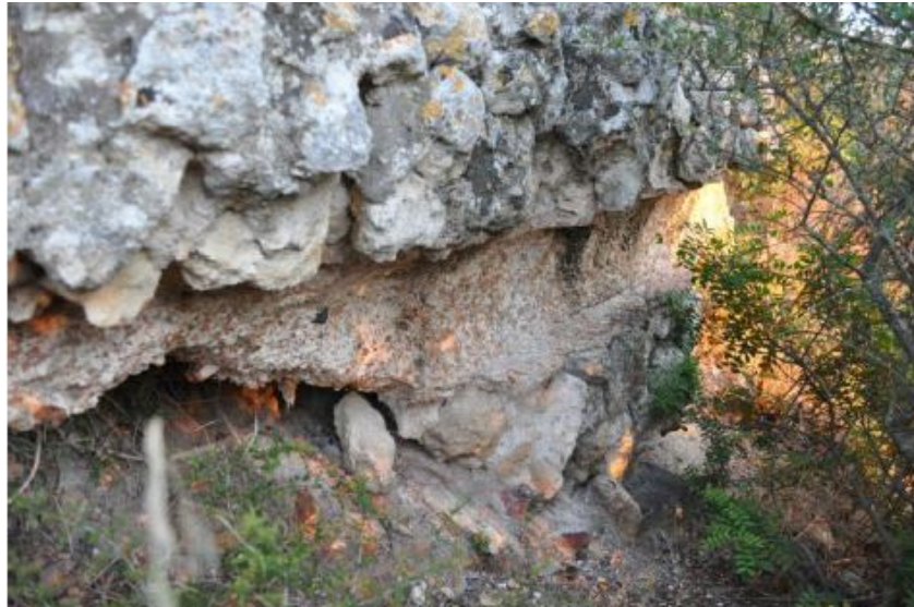
Fig. 5 - Segment de l'aqueduc (Fantauzzi, De Vincenzo 2013, p. 3, fig. 3).

Les attestations de thermes d'été sont extrêmement rares et l'intégration proposée par l'épigraphie de Cornus ([ Thermae ] / aestivae ) pourrait dériver d'un épisode de l' Historia Augusta selon laquelle Gordien III fit construire des termes sui nominis vers 240 14 . Vu que les structures interprétées comme des thermes à Columbaris datent du IIIe siècle, tout comme celles que l'on construit à la demande de l'empereur, on pourrait supposer que ce type de structure s'était diffusé au cours du même siècle 15 .