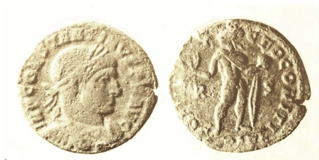
Fig. 3 - Columbaris - Secteur IV, 1 : aes de Constantin, 317 ap. J.-C., (CUGLIERI I, tab. XXXIX).

Les exemplaires de l'époque romaine impériale (fig. 3-5) datent de la période comprise entre le III e s. ap. J.-C. au VI e siècle ap. J.-C. et ceux qui sont liés aux règnes des empereurs de Gallien (253-258 d.C.) à Justinien I er (527-565 ap. J.-C.) sont les plus nombreux. En outre, on a découvert 28 pièces de monnaie vandales dont deux proto-vandales, tandis que les pièces restantes se réfèrent au règne de Gutamondo (484-496 ap. J.-C.), de Trasamondo (496-523 ap. J.-C. - fig. 6 - et Ilderico (523-530 ap. J.-C.).