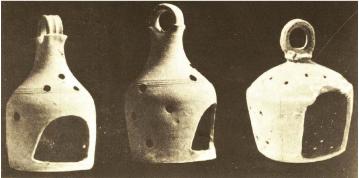
Fig. 4 - Porte-lampes palestiniens (GIUNTELLA et alii 1985, p. 78, fig. 71).