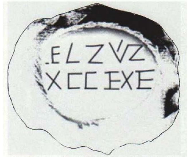
Fig. 2 - Gemme gnostique provenant de la Loc. Sisiddo, verso (MARTORELLI 2004, p. 261, fig. 3 ; p. 262, fig. 5).

Les textes sont liés au contexte magique et symbolique : on identifie sur la face principale des invocations aux Christ et aux anges tandis qu'on ne distingue aucun mot sur la face opposée. Ces dernières séries de lettres pourraient correspondre à une valeur numérique dont la somme totale pourrait symboliser les jours et les saisons, d'après la kabbale juive. Les deux inscriptions présentent des similitudes avec les textes présents sur les amulettes (cf. fig. 3) liés aux pratiques mystérieuses gnostiques avec des formules dites magiques en raison de la musicalité des expressions. Elle pourrait représenter des invocations au Christ, à Ananie, à l'archange Gabriel et aux anges, des formules standardisées dans lesquelles on rappelle la descendance.