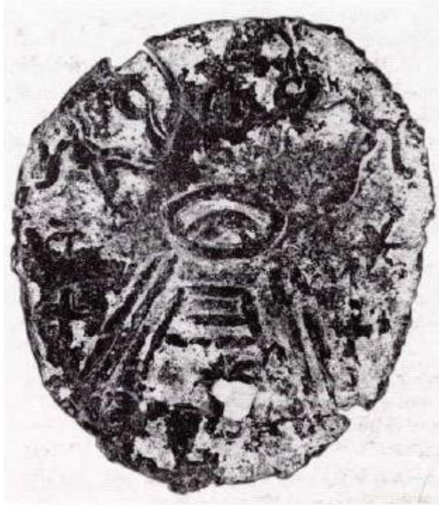
Fig. 4 - Cabras, Loc. San Giorgio : gemme magique (AGUS 2002, p. 33, fig. 4).