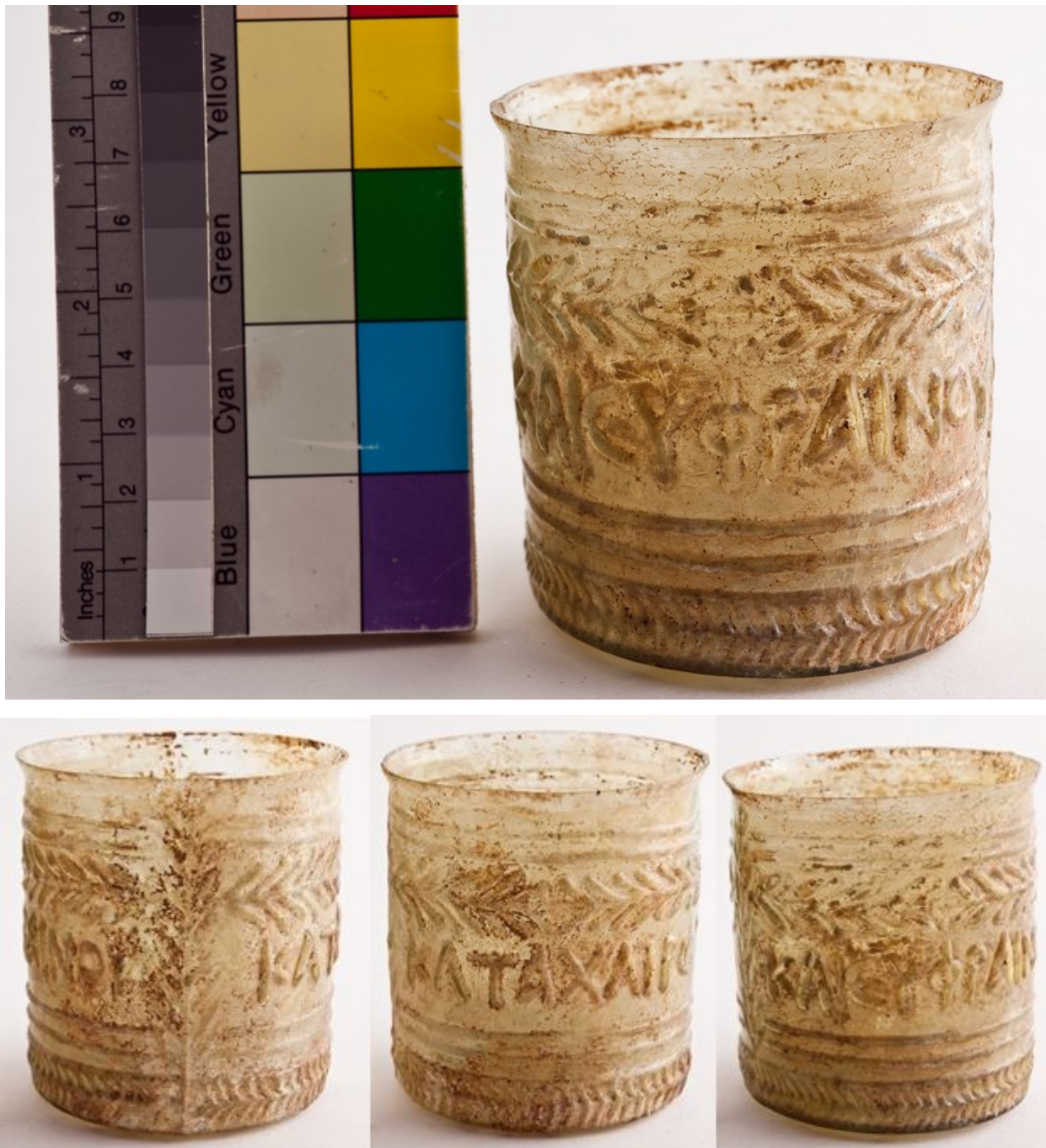
Fig. 2 - Cagliari, Musée Archéologique National : verre avec inscription provenant de Cornus (coll. Guoin), (photo de N. MONARI- RA_00163375/R.A.S.).

collection de Mrs. W. H. Moore à New York. Ces objets appartiennent aux productions des maîtres « sidonii » de la deuxième moitié du I er siècle de notre ère, reproductibles au Liban, à la Palestine, à Chypre et à la Syrie. Ils sont attestés dans différentes régions d'Italie du centre et du Nord (fig. 3), tandis que le seul cas méridional connu à ce jour - outre l'exemplaire sarde - a été découvert en Calabre, à Copia (fig. 4), l'actuelle Sibari.