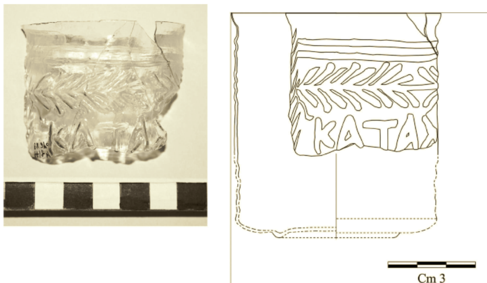
Fig. 4 - Copia/Thurii, cimetière à l'extérieur de la Porte Nord : fragments de verre avec inscription Kata[chaire kai Euphrainou] (D'ALESSIO, LUPPINO 2012. p. 357, fig. 4).

Sur le deuxième exemplaire (fig. 5) dont le verre est jaune orangé, l'inscription \Lambda BETHN NEIKHN « prends la victoire » est encadrée par deux séries de deux cercles concentriques unis par des lignes en rayon dans la première et dans la troisième bande : D. B. Harden l'attribue à un groupe dont faisaient également partie deux autres exemplaires identiques réalisés avec un même moule provenant de Chypre, et conservés au British Museum. On a affirmé avec certitude que le verre de Cornus avait été réalisé avec la matrice