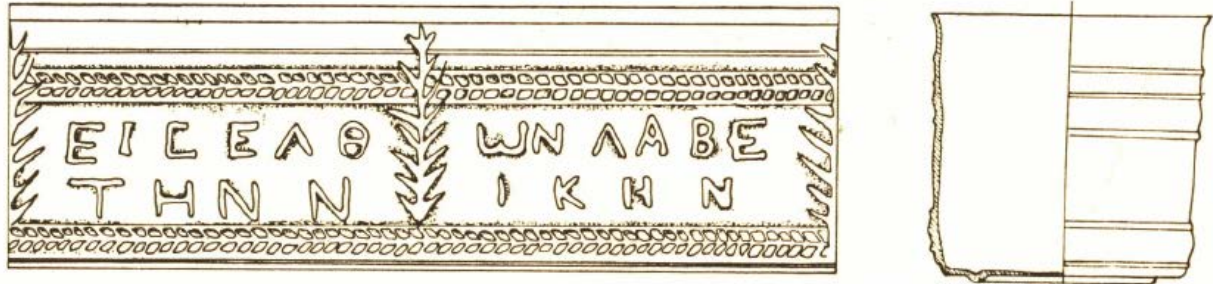
Fig. 6 - Cagliari, Musée Archéologique National : représentation graphique d'un verre cylindrique provenant de Cornus (CUGLIERI I, tab. XXI).

plat. D. B. Harden intègre l'objet en verre à un groupe constitué par deux autres exemplaires seulement conservés au Louvre ; le premier a été découvert à Kerch, en Crimée, tandis que l'autre élément vient plutôt de Syrie. Les trois exemplaires semblent avoir été réalisés avec une seule matrice. La signification de l'inscription semble suggérer la participation à des concours de boisson.