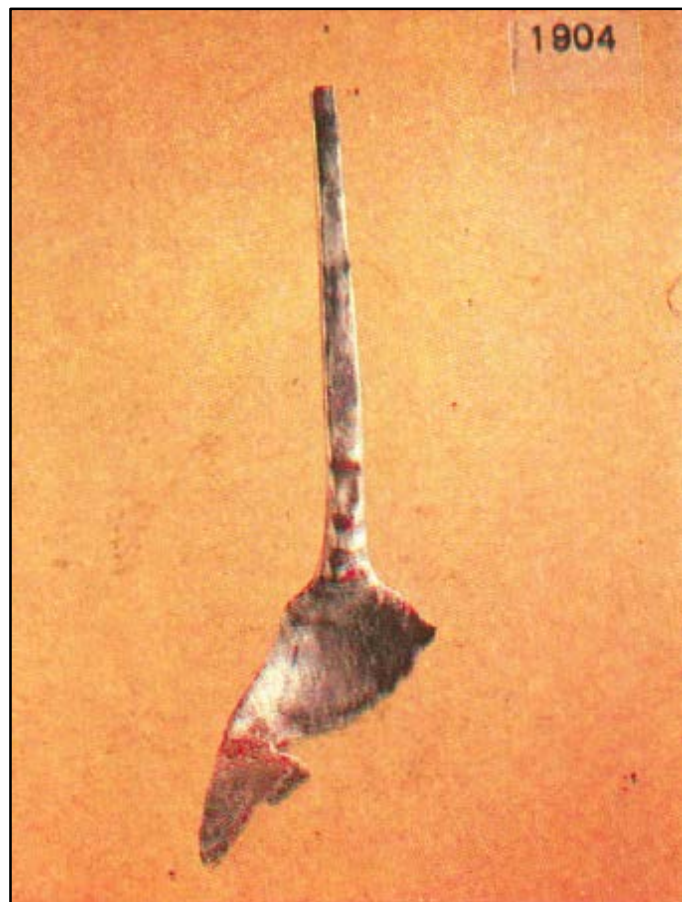
Fig. 2 - Cornus : petite cuillère en argent (CUGLIERI I, fig. 21)