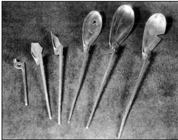
Fig. 3 - Petites cuillers provenant du trésor de Sucidava (RĂDULESCU LUNGU 1989, p. 2594, fig. 23).