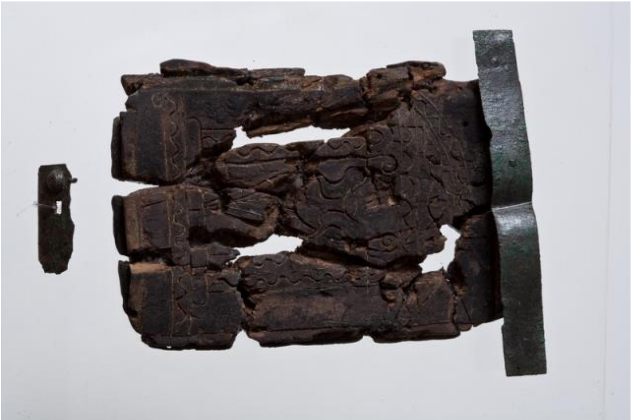
Fig. 4 - Couvercle en liège avec décoration.

La partie supérieure de la châsse était sans doute coulissante, grâce à des charnières en bronze fixées sur les côtés et dans la marge supérieure au moyen de clous fins (fig. 4). Les fragments qui constituent le couvercle révèlent une décoration réalisée avec un mince fil d'argent inséré dans le liège gravé.