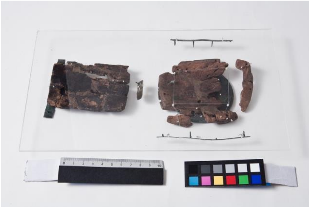
Fig. 2 - Châsse en liège et miroir en bronze.

L'objet est caractérisé par un disque en bronze présentant une face concave réfléchissante sans décoration (fig. 3) ; il appartient au type « en boîte » utilisé dès l'époque étrusque.