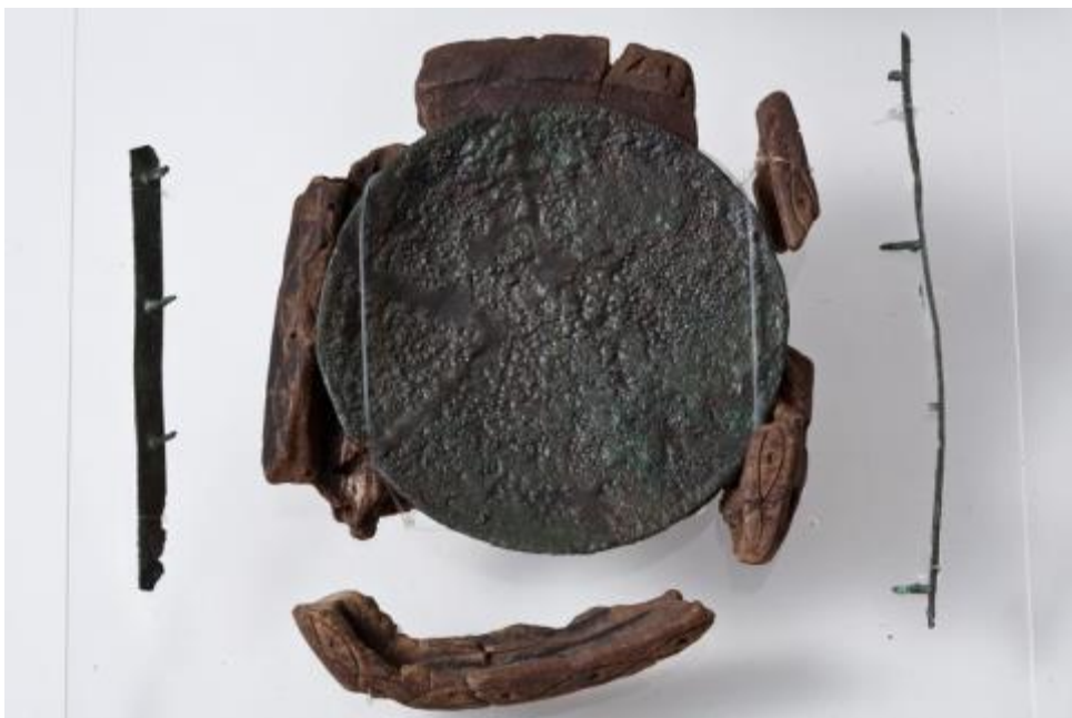
Fig. 3 - Miroir en bronze.

L'objet est caractérisé par un disque en bronze présentant une face concave réfléchissante sans décoration (fig. 3) ; il appartient au type « en boîte » utilisé dès l'époque étrusque.