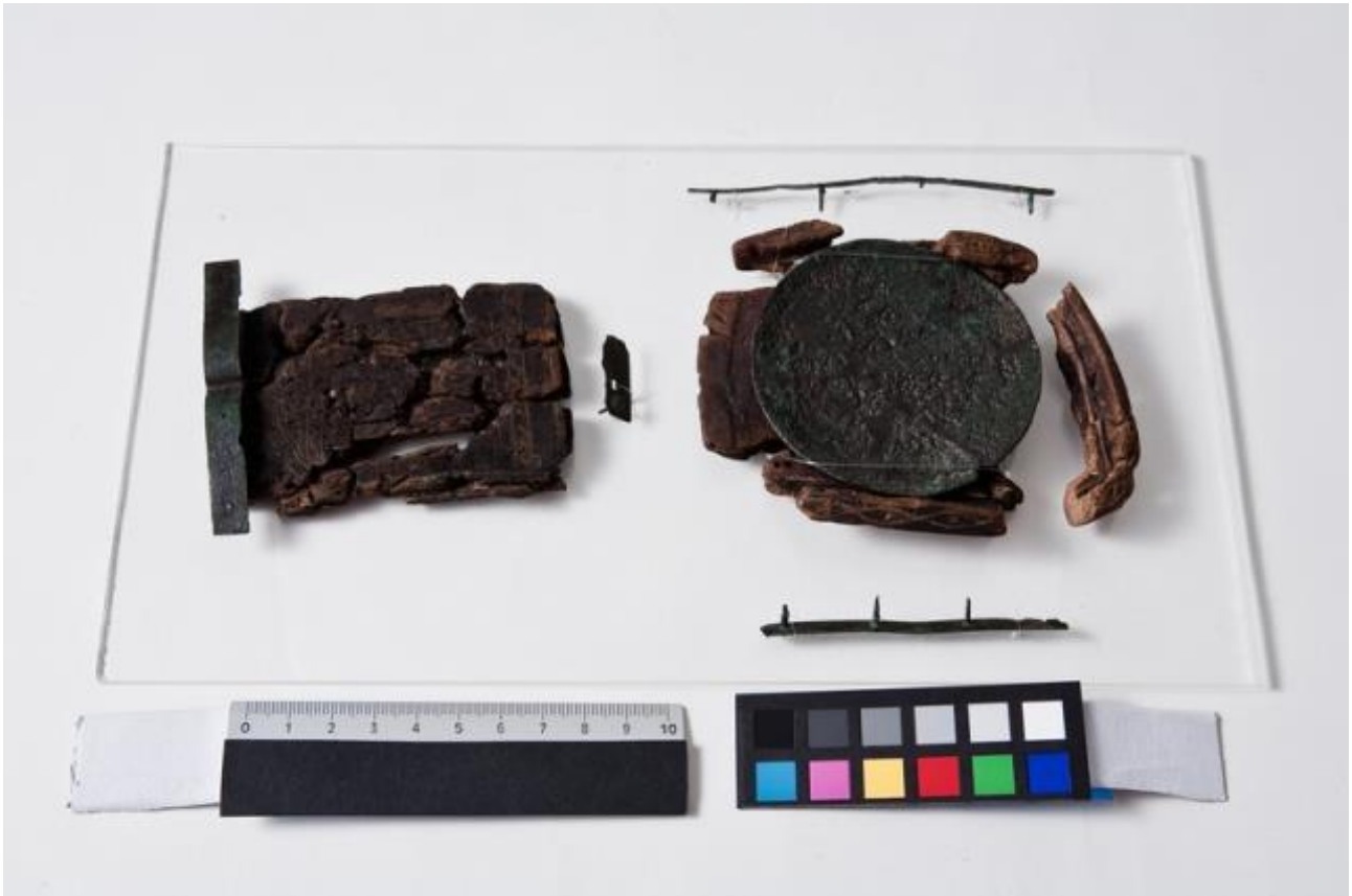
Fig. 1 - Châsse en liège et miroir en bronze.