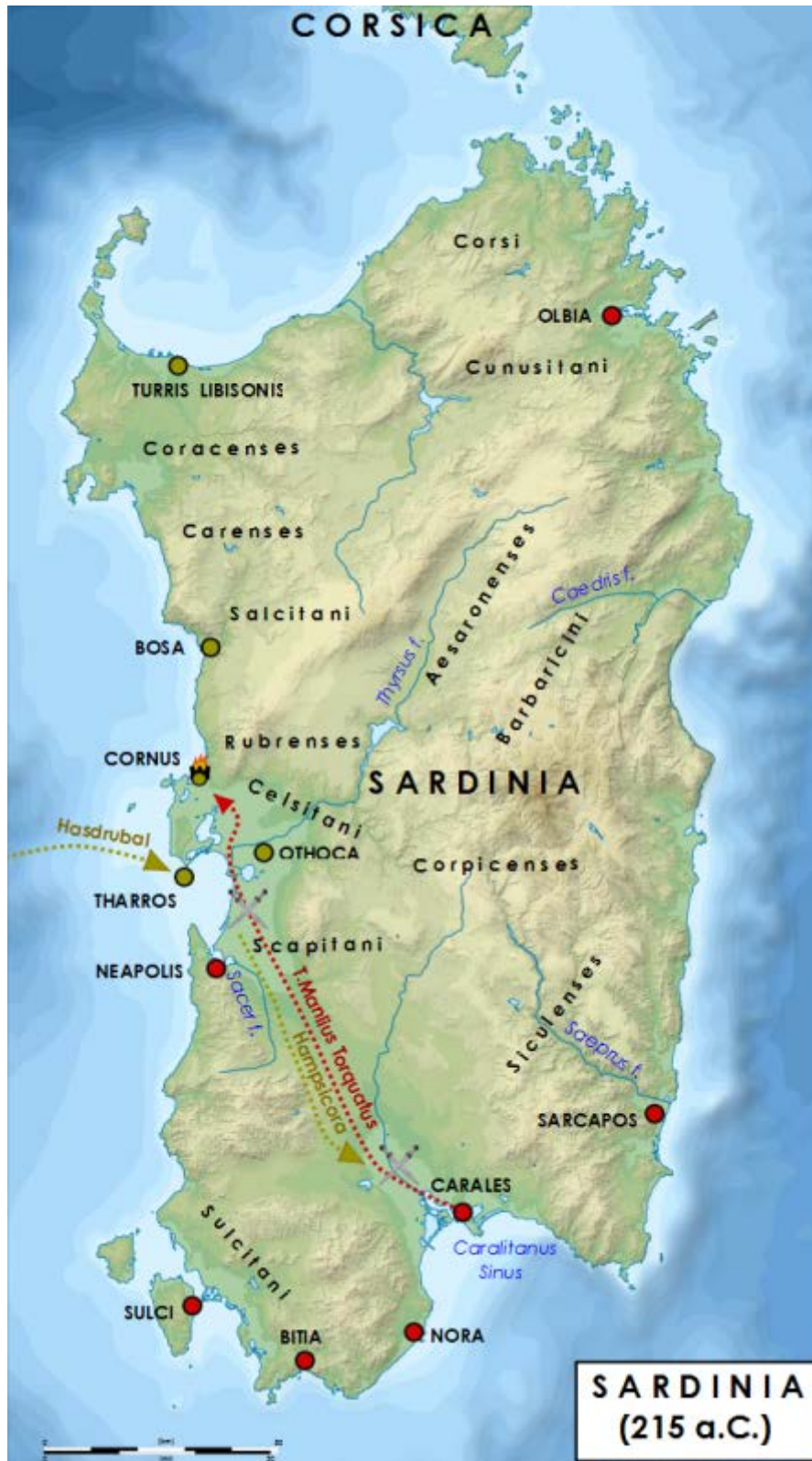
Fig. 5 - Parcours suivi par les troupes et lieux de la Bataille de Cornus ( http://it.wikipedia.org/wiki/Ampsicora#/media/File:Sardinia_215_aC_-_Ampsicora_rivolta.png ).