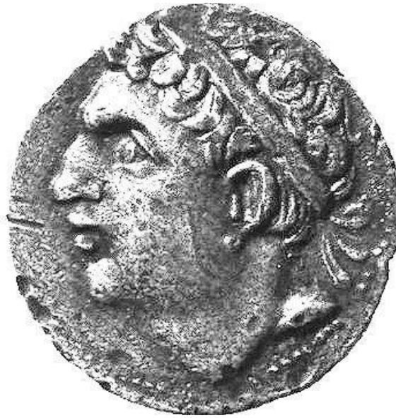
Fig. 3 - Pièce de monnaie d'Asdrubale ( http://nonciclopedia.wikia.com/wiki/File:Moneta_di_Asdrubale.jpg ).

On doit essentiellement la connaissance de ces événements au XXIII e livre des Histoires de Tite-Live (fig. 4), qui avait puisé une très grande partie des informations sur les guerres puniques et sur le bellum sardum dans l'ouvrage de Polybe, qui avait vécu un certain nombre des faits historiques décrits dans ses narrations. D'autres détails concernant les épisodes militaires de 215 av. J.-C. émergent de l'ouvrage du poète Silius Italicus .