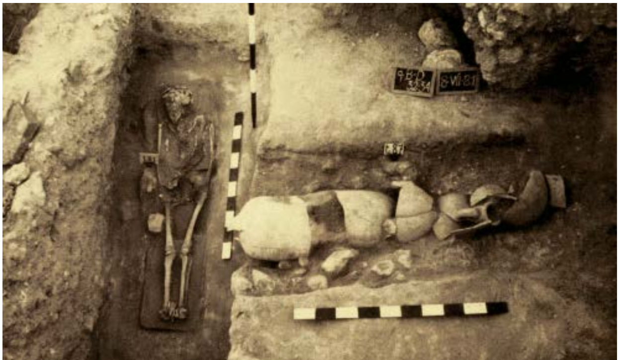
Fig. 1 - Partie orientale du cimetière, secteur Sud, tombe 87, vue de l'Est (GIUNTELLA 1990, p. 217, fig. 3).

La zone de Columbaris était utilisée dès la première moitié du IV e siècle comme un cimetière : les tombes creusées dans le banc de la roche mère étaient du type à cappuccina ou à enchytrismos (fig. 1) ; certaines étaient recouvertes d'une chape, d'autres de tumuli prismatiques ou elliptiques crépis et parfois peints en rouge (fig. 2).