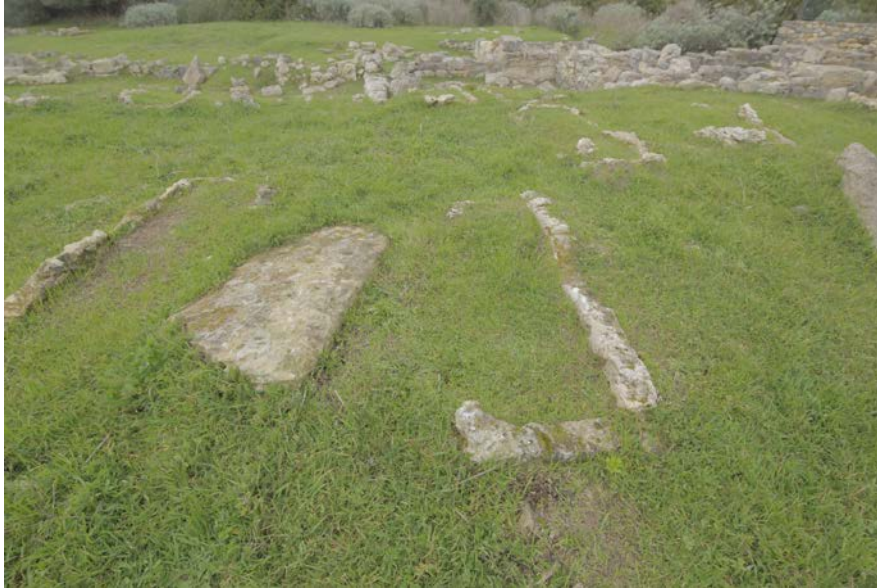
Fig. 5 - Le cimetière dans son état actuel.

La zone fut abandonnée vers la deuxième moitié du VIIe siècle, probablement en raison d'un énorme incendie dans la zone des basiliques qui finirent par s'écrouler sur la nécropole (fig. 5).