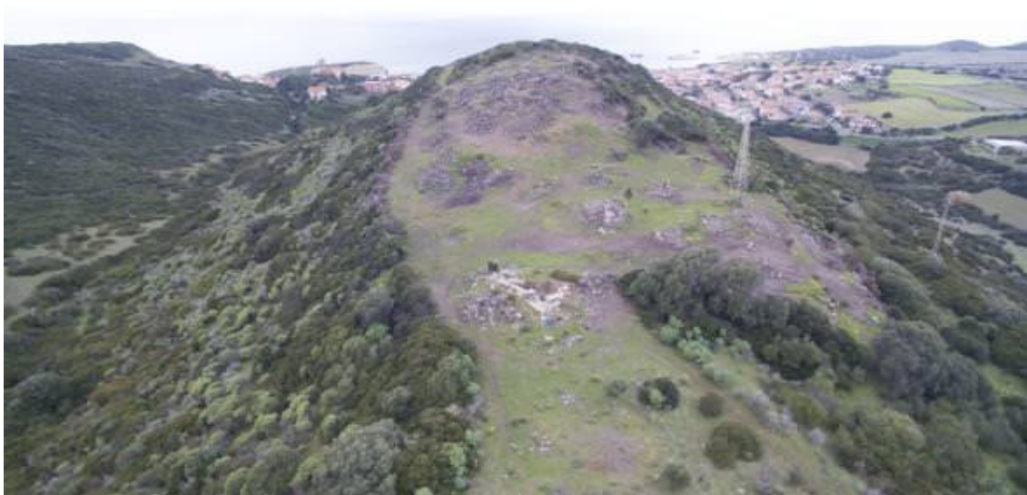
Fig. 1 - Colline de Corchinas.

La fondation du village remonte à l'Antiquité : au cours des dernières décennies du VI e siècle avant notre ère, les Carthaginois construisirent une cité probablement située sur le haut plateau de Campu 'e Corra, qui était un élément important pour la conquête de l'île. Elle se configurait comme une sorte d'avant-poste militaire pour le contrôle du Montiferru, afin de limiter les incursions des autochtones en direction de la plaine du Campidano. Les vestiges les plus évidents de cette période historique sont les structures architecturales et le matériel relatif aux quartiers situés autour de la colline de Corchinas, sur laquelle se situait probablement l'acropole, défendue par un mur d'enceinte. Une des particularités territoriales qui ont peut-être influencé le choix du site pour la construction de cette cité, fut la proximité de la mer et la possibilité d'exploiter un lieu sûr pour le débarquement, le Korakodes Portus , pour développer ses activités commerciales : le village devait sans doute son importance à sa position stratégique associée à cette caractéristique. Dans un moment d'incertitude comme la période des Guerres Puniqes, Cornus devint le porte-drapeau de la révolte anti-romaine sous le commandement d'Ampsicora.