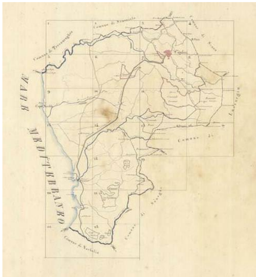
Fig. 2 - Feuille d'union des tablettes du Catasto De Candia (Cuglieri) : on y indique la voie en direction de Bosa.

La défaite fut le prélude de la conquête de la Sardaigne par les Romains, en 238 av. J.-C., confirmée en 227 av. J.-C. par la constitution d'une province qui comprenait la Sardaigne et la Corse. Sous la domination romaine, la cité fut très probablement implantée sur le village précédent et élevée au rang de municipium au moins à partir de l'époque de Flavius ou de Trajan. À l'époque impériale, le village s'étendit dans les environs qui furent caractérisés par la construction de villas comme à Sisiddo, Lenàghe et peut-être Columbaris. Dans cette dernière région - située dans la périphérie nord de la cité et desservie par un diverticulum fonctionnel reliant Cornus et Gurulis Nova (fig. 2) - la découverte de structures imperméabilisées avec des revêtements hydrauliques et du cocciopesto a permis de supposer l'existence d'un complexe thermal, vraisemblablement lié à la villa suburbaine. Les fouilles, qui ont duré une vingtaine d'années, ont permis de mettre au jour une zone de 4000 m 2 et l'on découvrit les vestiges d'une insula episcopalis structurée en secteurs à caractère funéraire et cultuel, peut-être reductible à l'ancien diocèse de Senafer .