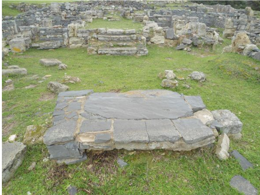
Fig. 8 - Autel en basalte avec des plaintes latérales, vue de l'Ouest (photo de C. Cocco).

L'église baptismale (fig. 9) était marquée par l'abside à l'ouest, par un plan à trois nefs, par une entrée à l'est qui a été fermée par la suite et par des fonds baptismaux.