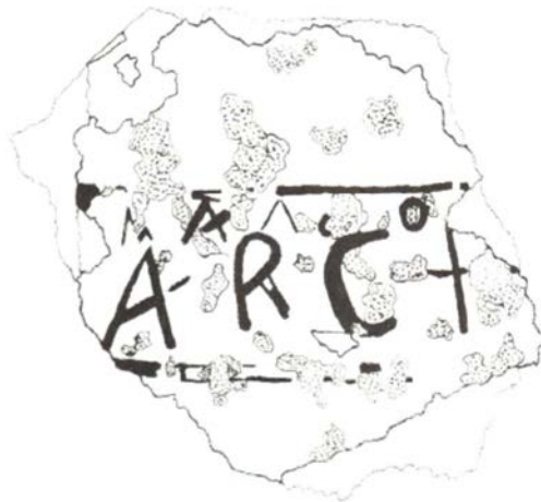
Fig. 6 - Reproduction graphique du fragment de crépi peint (de Mura 2008, fig. 2, p. 280).

Le contexte chronologique qui a émergé va de la construction de la colonnade (IV e siècle) au siècle suivant (V e siècle). La chronologie des pièces de monnaie découvertes au même endroit, attestant l'habitude de créer des trésors et d'utiliser des tirelires 5 est relativement singulière : les pièces de monnaie attestent une période chronologique qui va du I er au V e siècle 6 et elles avaient peut-être été longuement utilisées car la pratique de la thésaurisation n'impliquait pas la même dévaluation que représentait un achat de valeur. Le terminus post quem du V e siècle pourrait faire penser à un abandon inexplicable de la réserve d'eau extrêmement précoce par rapport à la durée de vie du site. La défonctionnalisation est sans doute attestée vers le VI e siècle lorsque les arcades commencèrent à s'effondrer et à se dégrader lentement, impliquant la réutilisation de ces éléments de construction, qui furent ensuite accumulés à l'intérieur du grand réservoir. On y retrouva les tuiles 7 qui recouvraient le toit en pente de la porticus, des morceaux de crépi peint provenant du mur du fond, rouge vif, et un fragment de crépi portant l'inscription arch- 8 (fig. 6).