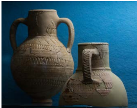
Fig. 4 - Petite amphore à deux anses et cruche à une seule anse avec motif en zigzag.

des habitants du quartier 3 : on identifie de petites amphores côtelées à une et deux anses, avec des gravures en zigzag (fig. 4), occupant tantôt tout le corps tantôt uniquement l'épaule, et d'autres gravures réalisées au peigne, en diagonale et horizontales, formant un motif géométrique (fig. 2) ; de petites amphores de l'époque byzantine ; des amphores africaines ; un exemple d'amphore en bronze (fig. 5) et des cruches en céramique soi-disant « flammée » 4 (fig. 1-2).