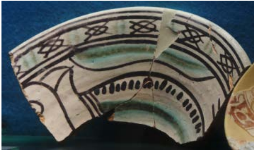
Fig. 3 - Assiette restaurée pour l'exposition.

La décoration laisse entrevoir des motifs géométriques et végétaux : en particulier, celui de la descente apparaît encadré par deux lignes et il est constitué par des éléments ovales bruns traversés par des croix. De par sa forme et sa décoration, cet exemplaire pourrait provenir de la zone de production de Manresa et il présente de nombreux points communs avec d'autres objets analogues retrouvés à Cagliari dans les églises Santa Restituta et Santa Chiara 3 et dans la zone archéologique de Vico III Lanusei 4 (fig. 4) .