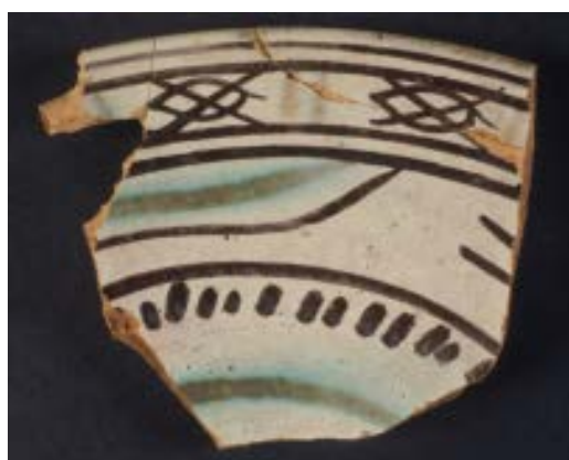
Fig. 2 - Fragment.

Soumis à une restauration, ils ont permis de reconstruire une assiette fragmentaire (fig. 3).