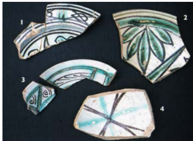
Fig. 4 - - Fragments d'assiettes et de coupes provenant de Vico III Lanusei (Deiana 2006, p. 226, fig. 146).

La décoration laisse entrevoir des motifs géométriques et végétaux : en particulier, celui de la descente apparaît encadré par deux lignes et il est constitué par des éléments ovales bruns traversés par des croix. De par sa forme et sa décoration, cet exemplaire pourrait provenir de la zone de production de Manresa et il présente de nombreux points communs avec d'autres objets analogues retrouvés à Cagliari dans les églises Santa Restituta et Santa Chiara 3 et dans la zone archéologique de Vico III Lanusei 4 (fig. 4) .