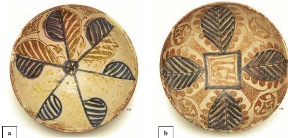
Fig. 4 - Cagliari, Pinacothèque Nationale : (a-b) Bol provenant de Valence du type Pula (da Martorelli 2007, p. 82, figg. 139-140).

sarde du même nom et conservés dans la Pinacothèque de Cagliari 3 (fig. 4a). Parmi le matériel de la collection, une coupe provenant de Valence et datant de la première moitié du XIV e siècle présente des points communs avec celle découverte dans la crypte 4 (fig. 4b).