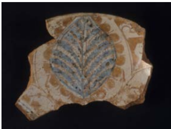
Fig. 1 - Fragment avec un élément végétal

Sous la chapelle méridionale dans laquelle on aperçoit la seule crypte latérale qui a résisté au temps, des couches de terre ont restitué des fragments de céramique ibérique du XIV e siècle 1 , dont les plus intéressants sont reductibles à la faïence décorée en bleu et lustre (fig. 1-2). Leur restauration a permis de recomposer une coupelle hémisphérique (fig. 3).