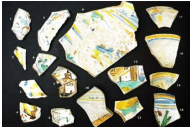
Fig. 3 - Céramique provenant de Montelupo de Vico III Lanusei (CARTA 2006, p. 209, fig. 138).

Ce type d'assiette a été fabriqué pendant une longue période, probablement entre 1570 et 1630 4 . Une autre interprétation possible met l'exemplaire de S. Eulalia (fig. 1) en relation avec le type « à feuilles de vigne », fabriqué pendant tout le XVII e siècle 5 . La bassine en revanche présente une décoration comparable avec le type défini « à spirales vertes », en raison de la présence au niveau de la descente d'une décoration typique représentant une guirlande verte et orange (cf. fig. 4).