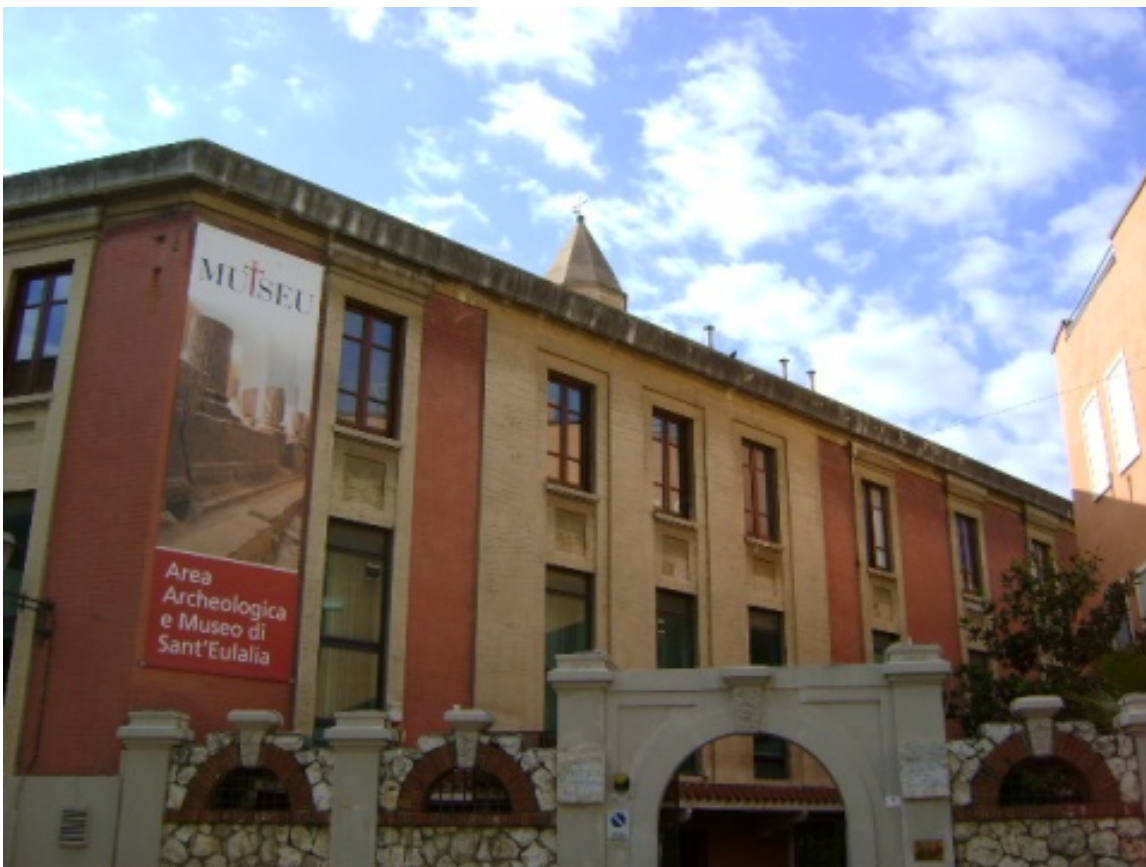
Fig. 1 - Entrée de la zone muséale de Sant'Eulalia-MUTSEU ( http://www.cagliariturismo.it/it/luoghi/i-luoghi-dell-arte-e-della-cultura-319/musei-12/museo-del-tesoro-di-sant-eulalia-47 ).

Le MUTSEU (fig. 1), le complexe muséal de Sant'Eulalia, se situe dans la ruelle vico del Collegio 2 , dans un bâtiment adjacent à l'église du même nom, dans le quartier historique de Marina a Cagliari : il comprend la zone archéologique, l'exposition des pièces provenant du site et le musée du Tesoro (fig. 2) 1 .