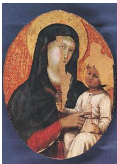
Fig. 4 - Atelier toscan, Madonna con Gesù Bambino (datant de la moitié du XIV e siècle), détrempe sur planche ( http://it.cathopedia.org/wiki/Museo_del_Tesoro_e_area_archeologica_di_Sant%27Eulalia_%28Cagliari%29 ).

Au premier étage est exposé le patrimoine historique et artistique des trois églises Sant'Eulalia, Santa Lucia et Santo Sepolcro situées dans le même quartier, c'est-à-dire de l'argent, des parements sacrés, des statues en bois appartenant à la période comprise entre 1500 et 1700 ainsi que des tableaux d'une grande valeur (fig. 4).