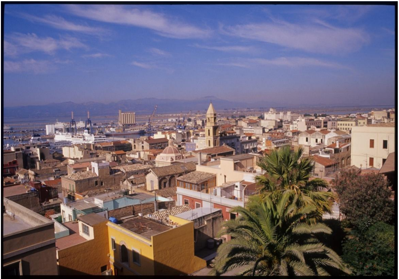
Fig. 4 - Vue d'ensemble du quartier de Marina, où se dresse le clocher de l'église Sant'Eulalia.