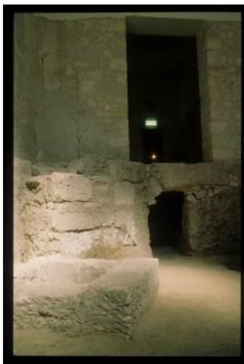
Fig. 1 - La première découverte : margelle du puits et cloison du XVII e siècle au-delà de la sacristie.