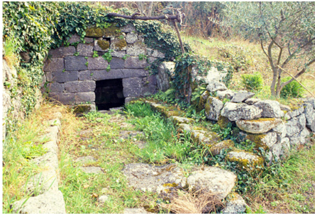
Fig. 1 - Fontaine nuragique de Su Lumarzu ( http://www.sardegna.cultura.it/immagini/7_88_20070118152906.jpg ).

La Fontaine Lumarzu, près de Rebeccu à Bonorva (fig. 1), découverte au début du XX e siècle et datant de la période comprise entre le Bronze Final et le Premier Âge du Fer, a restitué un petit vase particulier à quatre anses en miniature à caractère votif (fig. 2).