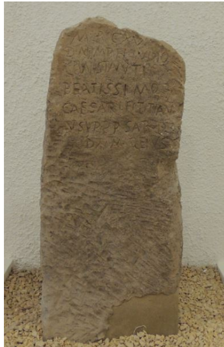
Fig. 1 - La borne miliaire découverte dans le village de Mura Menteda, Musée Archéologique de Bonorva.

En 1975, on récupéra à Bonorva, au cours de fouilles d'urgence réalisées dans le village de Mura Menteda, une borne miliaire en trachyte gris cendré de forme quadrangulaire (fig. 1).