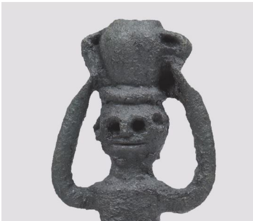
Fig. 4 - Statuette en bronze représentant une porteuse d'eau ; nuraghe Cabu Abbas-Olbia (Lo Schiavo 2014, p. 115).