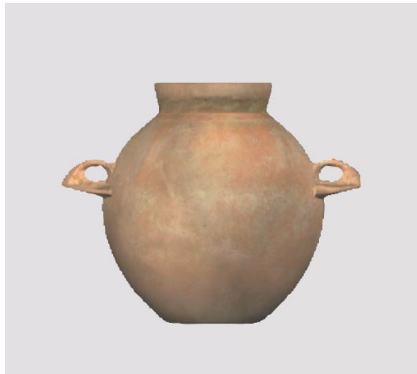
Fig. 2 - Vase en céramique à corps globulaire et anses en forme de coude renversé retrouvé sur le site de Pyla-Kokkinokremos (Lo Schiavo 2014, p. 115).