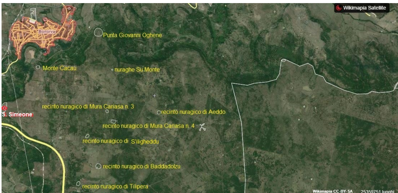
Fig. 1 - La zone des enceintes nuragiques (Wikimapia (réélaboration de M.G. Arru).

Le complexe architectural de San Simeone constitue un des nombreux biens archéologiques, architecturaux, historiques et monumentaux présents sur le territoire communal. La zone du complexe historique se trouve à une altitude de 625 m, sur le plateau de Su Monte , où la longue continuité anthropique est attestée par la présence de monuments datant d'une période chronologique qui va de l'Époque Nuragique au Moyen-Âge. Du haut de cette colline, d'une grande importance stratégique, on pouvait contrôler la route entre le haut-plateau de Campeda et le Meilogu ainsi que les voies de liaison entre le nord et le centre-ouest de la Sardaigne (fig. 1).