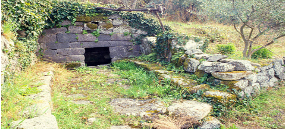
Fig. 4 - Fontaine nuragique de Su Lumarzu ( http://www.sardegnaicultura.it/immagini/7_88_20070118152906.jpg ).