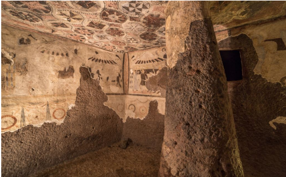
Fig. 2 - Scènes tirées du Nouveau Testament sur les murs du bêma.

Le plafond du bêma, décoré de motifs géométriques, a été creusé pour réaliser une lucarne quadrangulaire qui rejoint le plateau supérieur en traversant la Roche sur une épaisseur d'environ 5 m. On construit sous la lucarne l'autel paléochrétien, qui fut ensuite déplacé (probablement après le X e siècle) contre le mur sud-est du bêma où l'on avait réalisé l'abside (fig. 3). On entreprit sans doute des travaux d'entretien des surfaces peintes, au cours de la première moitié du XIV e siècle, quand l'église fut dédiée à Saint-André.