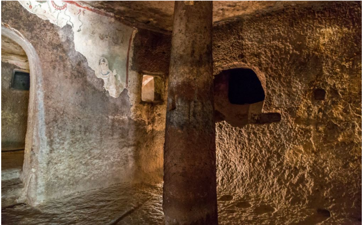
Fig. 1 - Fresque sur le mur de la salle.

Sur les murs du bêma, on aperçoit des fresques paléochrétiennes, sur lesquelles on a superposé des dessins à une époque successive (datant de la deuxième moitié du VIII e siècle ap. J.-C.) : le cycle décoratif avec des scènes du Nouveau Testament (Annonciation, Visitation de Marie à Élisabeth, Naissance de Jésus, Adoration des Mages, Présentation de Jésus au Temple, Massacre des innocents, Retour de la Sainte Famille d'Égypte (fig. 2) ; le Christ bénissant entouré des symboles des quatre évangélistes ; les Apôtres ; Saint Jean-Baptiste et la Vierge.